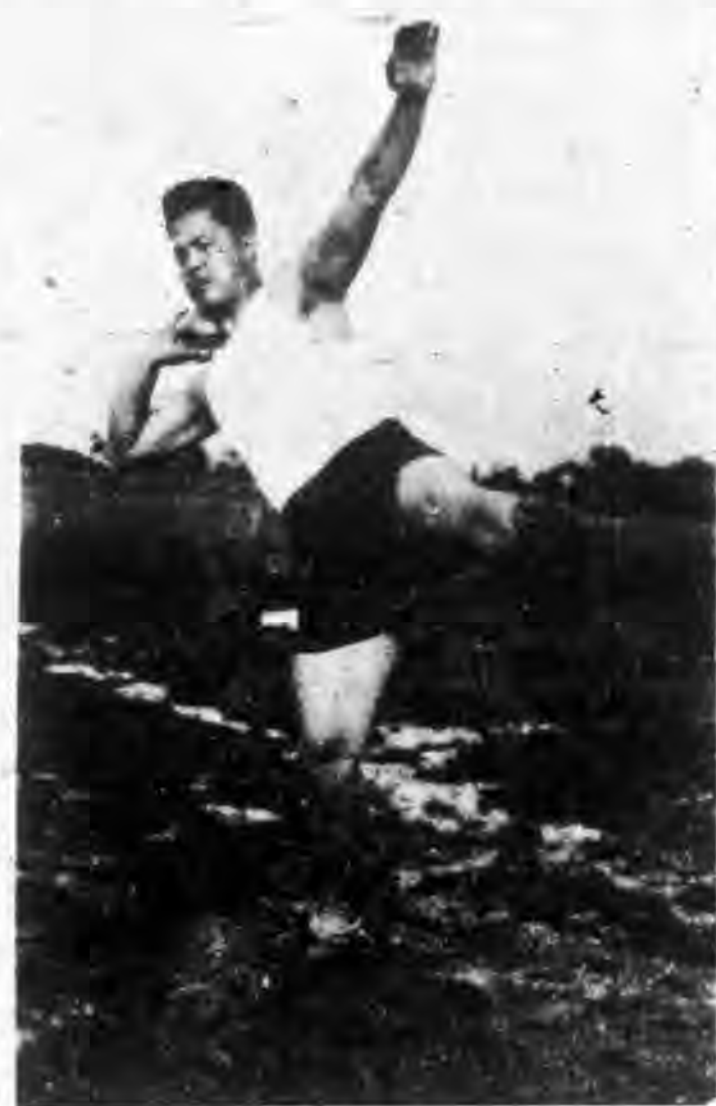
——宮萬育君鐵球鐵餅破江大紀錄——