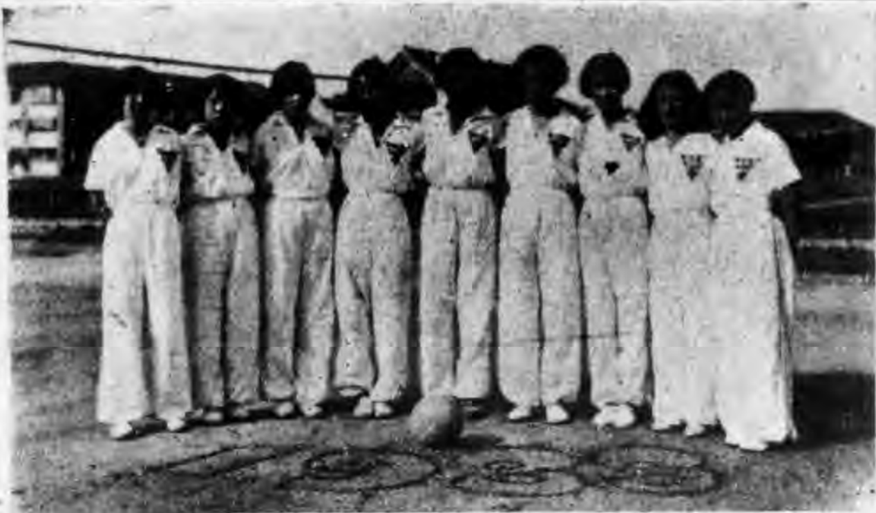
——暨大女子排球隊得本年江大錦標——