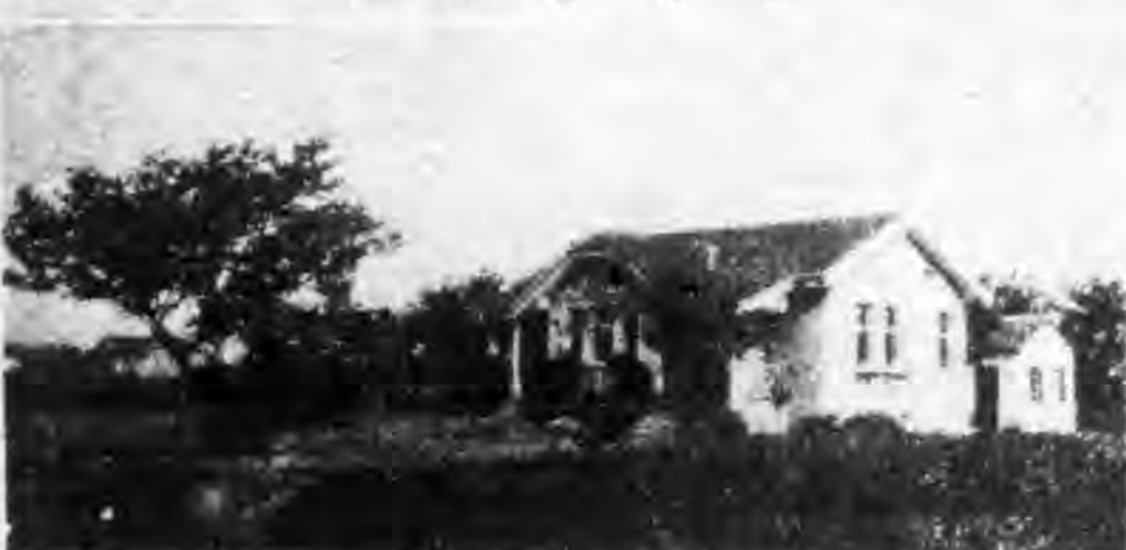
暨南新村教職員住宅