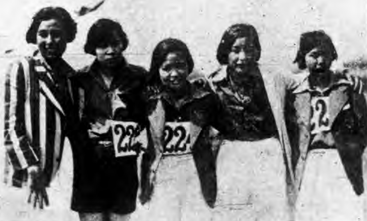
——本屆出席江大運動會之女選手——