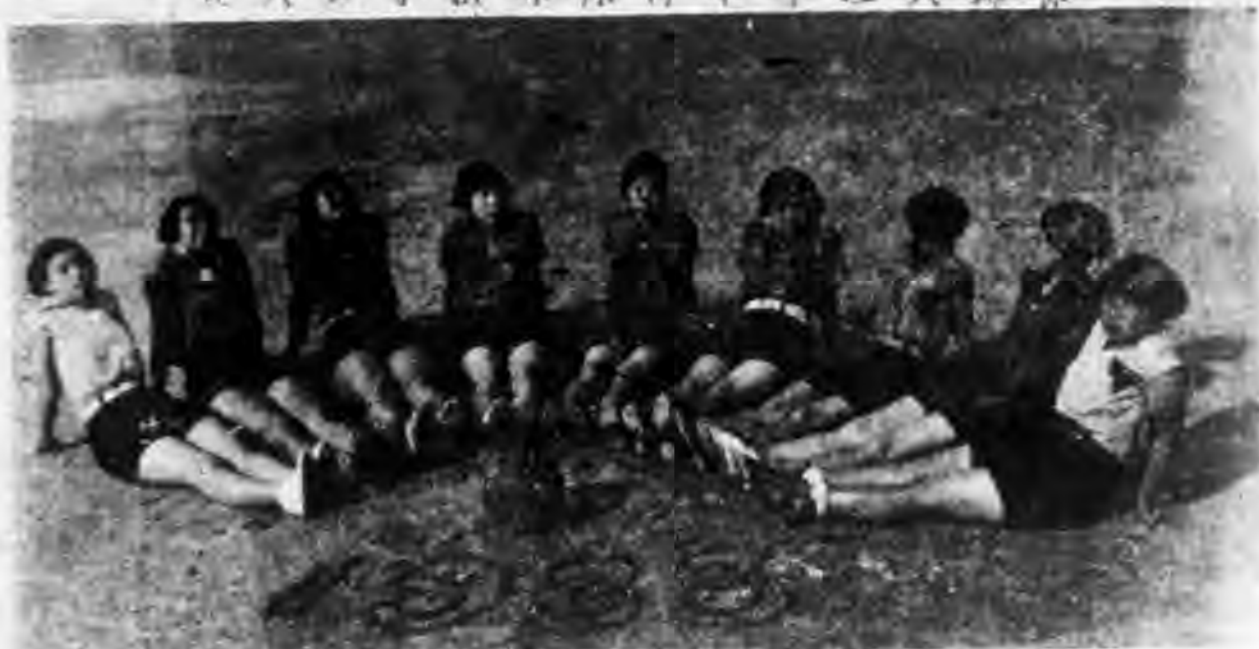
暨大女子籃球隊得本年江大錦標