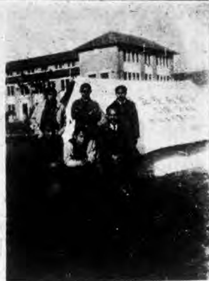
暨大童子軍之生活