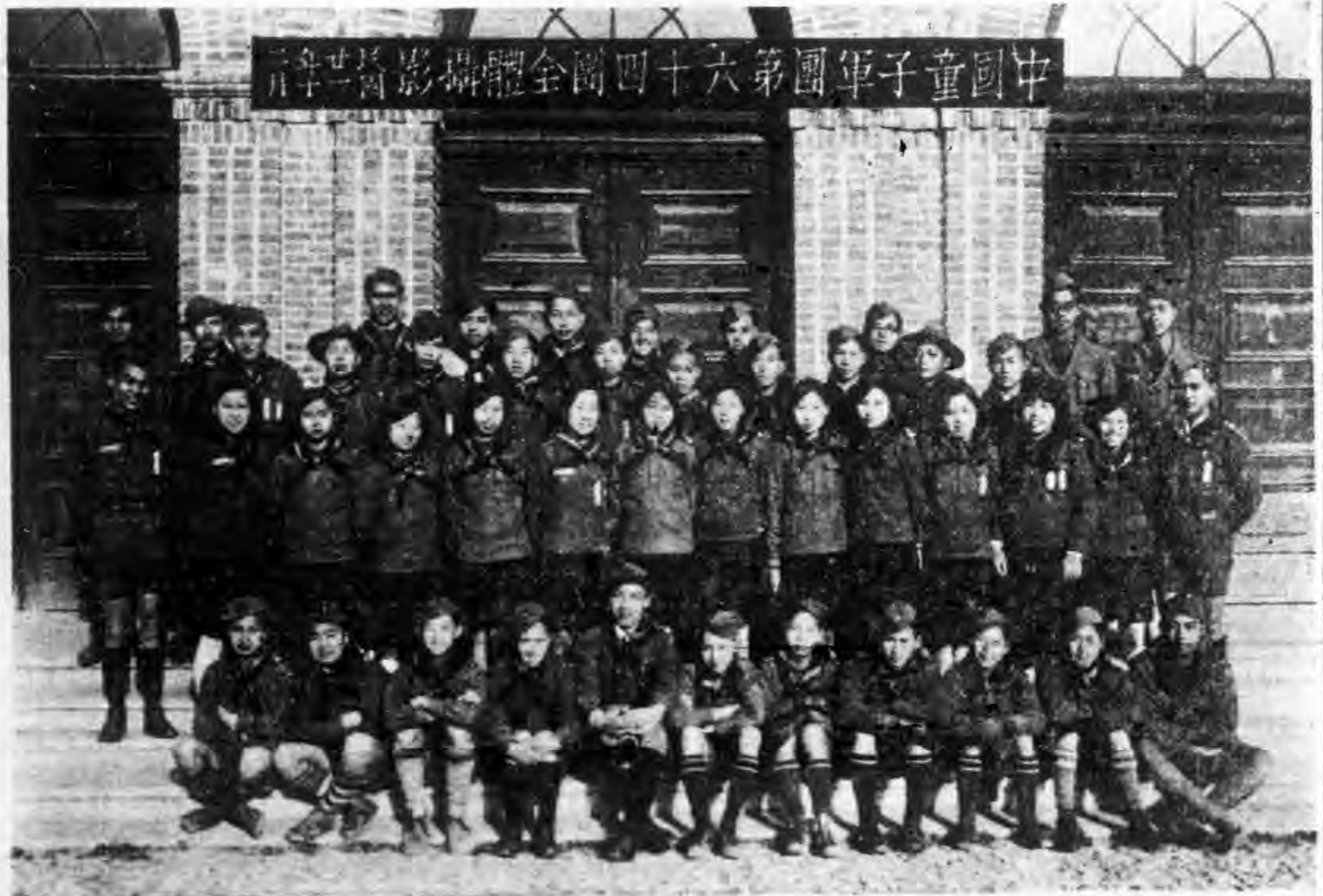
中華民國童子軍第四十六團全體攝影