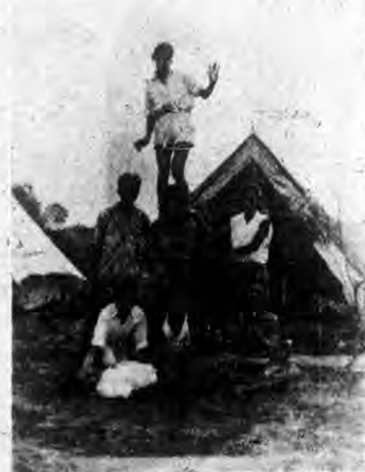
暨大學生之暑期生活——