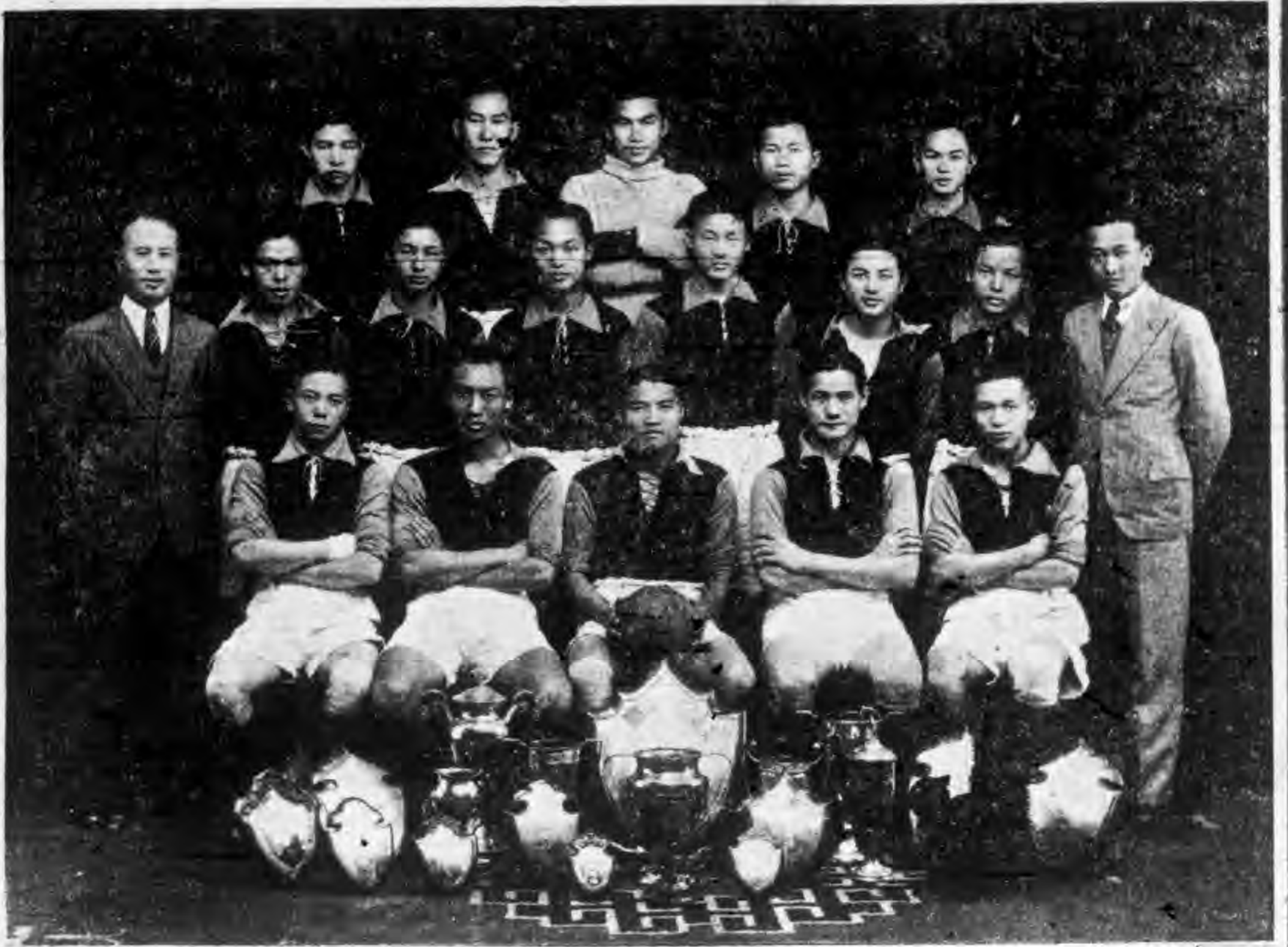
連執江大足球錦標七年之譽天足球隊