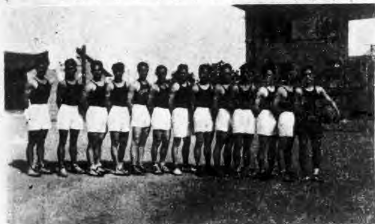
暨大籃球隊江大亞軍