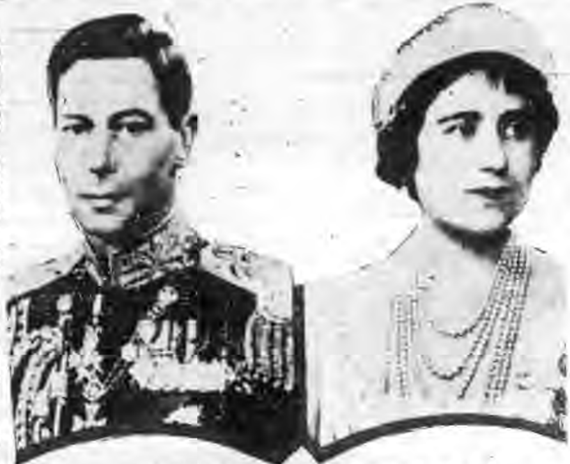
★英王喬治六世及后伊麗沙白近影★

與人口的英國，支配着十倍的人口與一百三十倍面積的世界！英國的屬地既如此之廣，方面又如此之多，所以它的外交政策也是多方面的應付，多方面的週旋；抑揚褒貶，不拘一格，縱橫開闢，以求自保。如