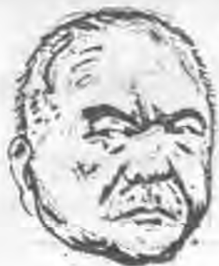
企圖打開日蘇僵局之局

帝國主義國家間相互的戰爭，所以儘量採取對外擴張的政策，而以中東路的讓渡為經緯，它認為這外必先安內，所以繼續不已的作大規模的清黨與肅軍，於是從拉狄克，布哈林，直到杜嘉契夫斯其，都是清黨肅軍的對象，它認為在世界政治的範圍中，有和平集團與侵略集團的兩大營壘，所以加入國際聯盟，維護和平政策。爲着這些原因，它一方面雖然譴責日本，一方面却遵守和平；日本對它雖然作得寸進尺的侮辱，但它爲了和平還是繼續不已的讓步，除非是日軍少壯軍人的木屐踏到西伯利亞，三宅坂的野馬跑到貝加爾湖，蘇聯總是不願意首先主動的對日本作戰！因爲有從一九一七年二月到十月的八個月，國內階級鬥爭的教訓，因爲有從一九一八年到一九三八年二十年的國際和平環境的熏陶，因爲有東西兩個戰場，——即同時對日與對德的作戰，因爲有維繫複雜的國際環境的限制，這些都是決定蘇聯不願即時對日作戰的因素。