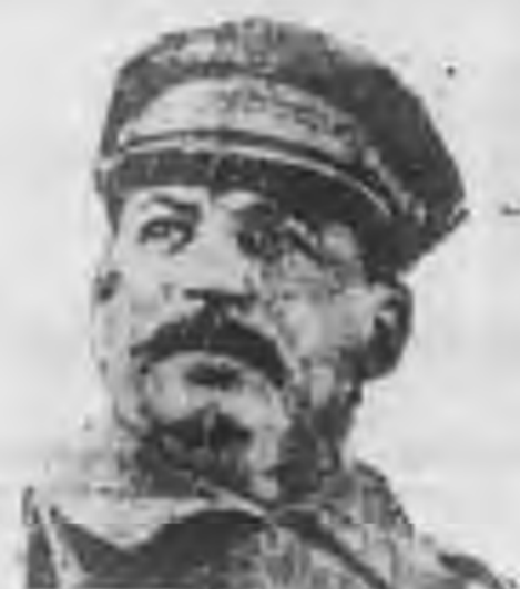
氏林大史 人主宮姬里克

經過了一星期之後，即本年六月六日，在莫斯科附近的事羅夫加村，又發生了俄偽邊境的糾紛；據莫斯科方面公報的消息，頗有俄滿水船一艘，內有日本間諜廿九人，携帶武器，企圖造成俄偽邊境緊張的局勢，所以被蘇聯或軍所扣留。但是日本亦復如法泡製，於六月十三日下午在間島地帶，唆使