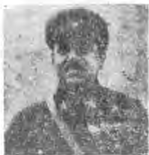
日蘇之中蘇聯之軍

頭上，以完成其「速戰速決」的迷夢。在中國堅決抗戰的過程中，它爲了遮斷中國與國際的交通的聯絡，亟欲一面以海軍的力量，向西南進攻，切斷我們與香港安南海上運輸的關係，與一面以陸軍的力量，向西北進攻，遮斷我們與外蒙新疆的聯繫，并從而斬斷我們與中亞細亞及西伯利亞陸上交通的脈絡，最低限度在目前，它還不至於輕舉妄動作進攻蘇聯的冒險。由於國家政體的不同，思想上的差異，地理上的糾紛，歷史上的仇恨，日本除非它內部的革命，在今後是不會自動放棄反蘇聯的標準野心，但是如果說日本馬上說對蘇聯作戰，那也未免言之過早；因爲日本資本主義先天弱質的結果，在某些方面，它目前對蘇聯還存有依賴的心理，尤其是北庫頁島的煤油，幾使它垂涎欲滴；它是一個缺乏煤油的國家，在戰時煤油對於它的價值，比血還重要。平時的國內產油量，每年不過二十萬噸，祇供其經常消費十五分之一，戰時的需要，恐怕要超過平時十倍，敵人從海軍到陸軍，從機械化的部隊到其空軍的陣地，均有賴