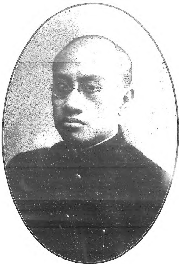
梁 漱 溟 先 生