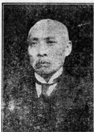
段 祺 瑞