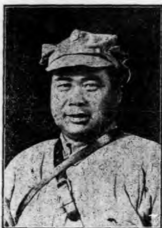
馮 玉 祥

月杪山東孫鼎臣，河南凌鉞，江蘇白玉崑等集於濰州，豐潤丁開璋率關東刀客亦至。遂約煙合都督商震與南方接洽，由秦皇島運輸軍械登陸，與海陽馮玉祥先解決山海關蕭廣傳范國璋部；以免後顧之憂，再取京津。定十一月中旬起義。上