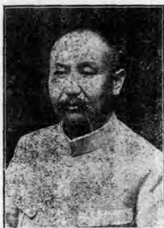
閻 錫 山

駿許顯等招募新兵，擴充革命實力。另設禮賢院徵集人材，故晉省政務清明為各省之冠。十四日清廷下詔悔過，命吳祿貞署理山西巡撫。吳與晉軍聯合斷清軍後路。並密約令旗兵攻晉，晉軍吳軍一舉殲之。陝西民軍閻筱泉李仲山等亦由潼