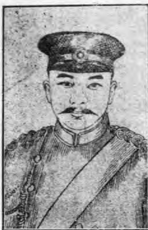
吳 祿 貞

版——，鼓吹平民精神。三年一月復刊國風日報，鼓動民眾監督政府。山東劉冠三，湖南仇亮，江西李烈鈞，湖北吳祿貞，田桐，直隸張紹曾等同志均藉此聯絡。及武昌革命軍興，北方各省繼踵起矣！