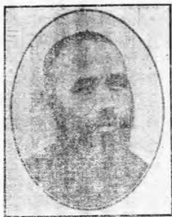
于 右 任

時于右任張鈞自北南兩路間道入陝，咸以靖國軍號令分歧指揮不能統一，以致形勢日蹙；眾推于為總司令張鈞副之，劉廷森為參謀長。郭楚魯胡高廬為大路司令。令楊彪與郭堅