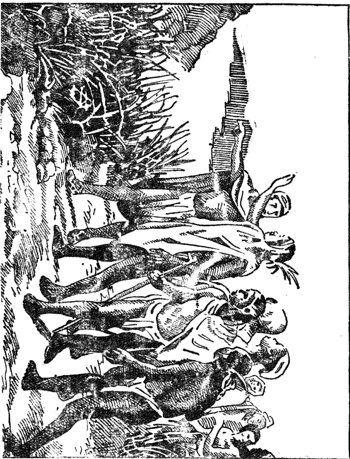
墨西哥國最初的阿爾的克族選擇根據地的狀況