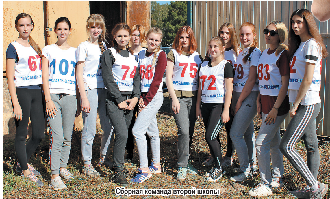
Сборная команда второй школы