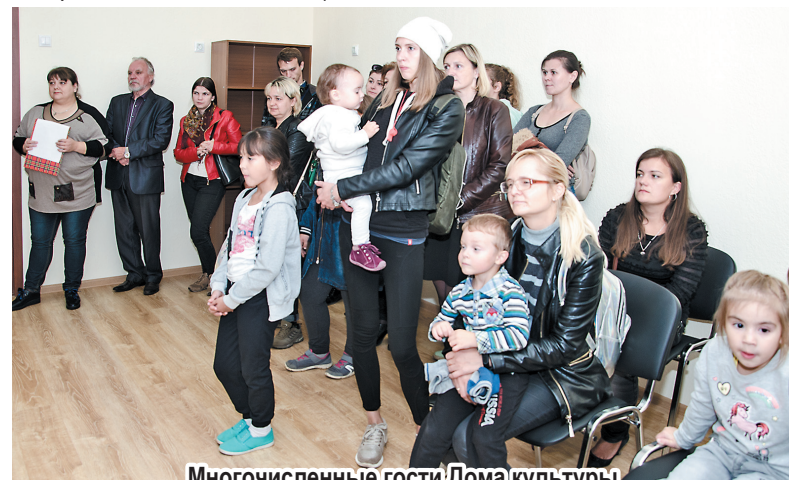
Многочисленные гости Дома культуры