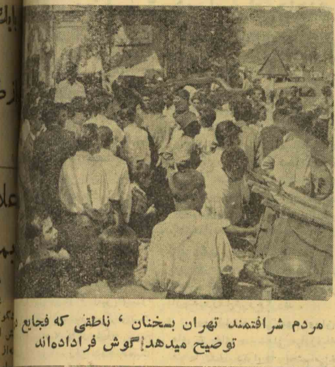
مردم شرافتمند تهران بسخنان، ناطقی که فجاجع توضیح میدهد گوش فراداده اند

بقیه از صفحه ۱ یک بعد از نیمه شب سرهنگ نصیری فرمانده... کارد شاهنشاهی با چهار کامیون و دو جیب... ارتش و یک زره بوش بقصد اشغال خانه دکتر