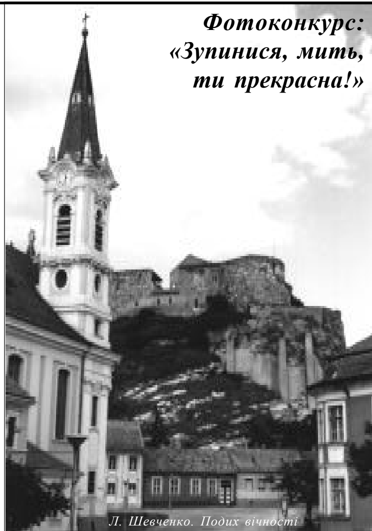
Л. Шевченко. Подих вічності