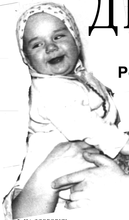
5. НА ЗДОРОВ'Я!

А якою бути самій, як діяти? Не відкладайте візит у жіночу консультацію, — там вам допоможуть з'ясувати термін вагітності, ретельно обстежать, дбатимуть про усунення хвороб та ускладнень, допоможуть підготуватися до пологів. Як правило, в районних консультаціях ви зможете зустрітися з юристом, з його допомогою ознайомитися із законами, на які варто опиратися у своєму материнстві. Там же ви можете почути поради дієтолога, проконсультуватися у психолога, як уникнути психічних травм, протистояти життєвим незгодам і стресам.