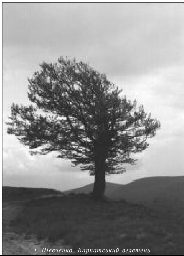
І. Шевченко. Карпатський велетен

Засновник — Всеукраїнське товариство «Просвіта» імені Тараса Шевченка. Реєстраційне свідоцтво № 1007 від 16.03.1993 р. Головний редактор Любов Голота