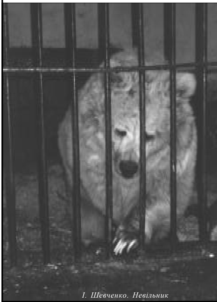
І. Шевченко. Невільник