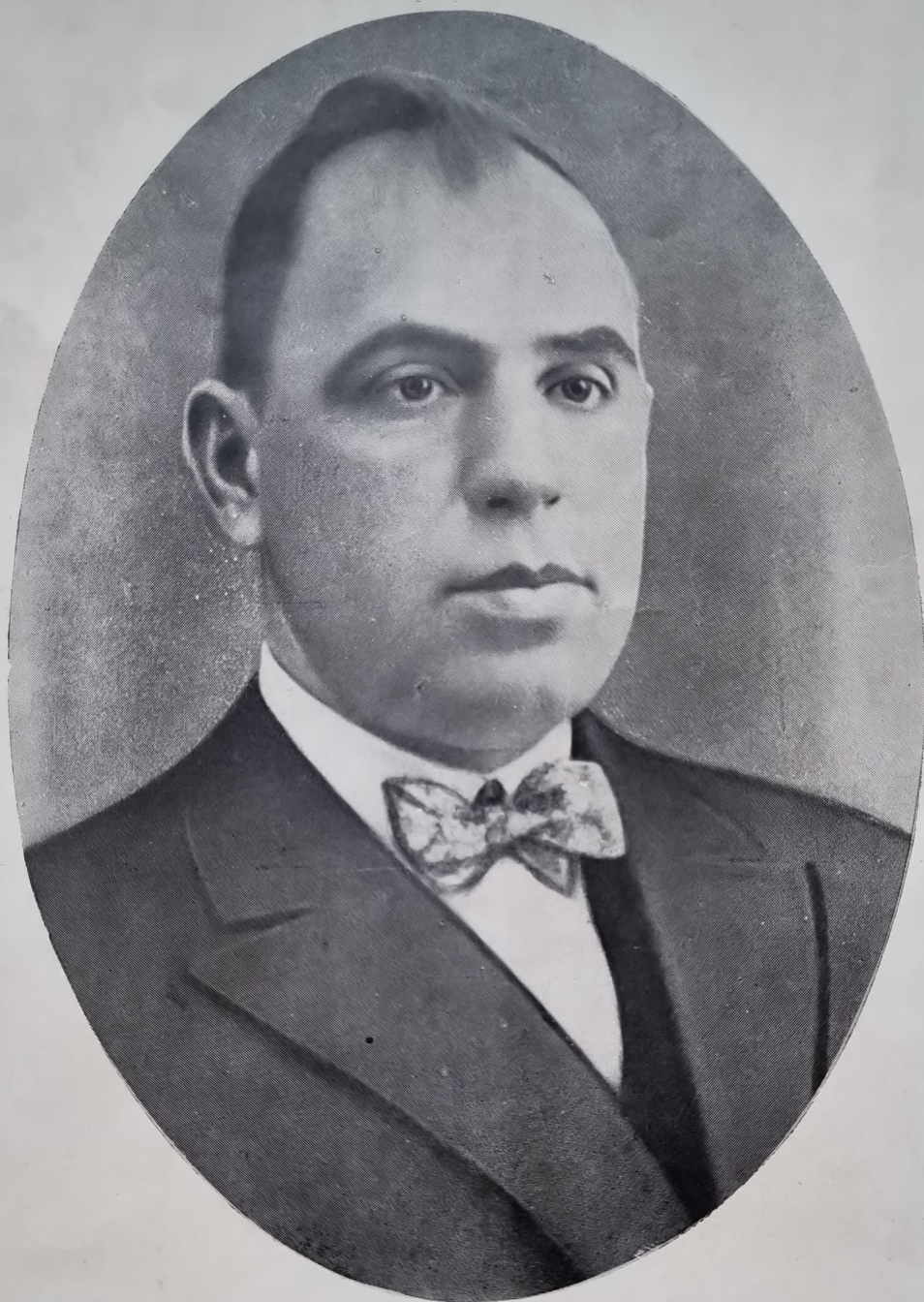
† МАНЕ К. НАКАШЕВЪ убитъ отъ предателска ржка на 21 януарий 1933 г.