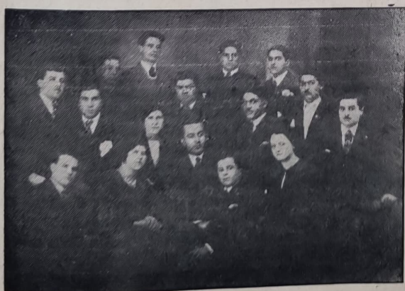
Театралната труппа при секция „Мане Накашевъ“

Голѣми бѣха препятствията, които трѣбваше да се преодоляватъ отъ наша страна. Но нека ни бжде позволена една малка нескромность. Въпреки тежкитѣ условия, при които бѣхме поставени да се развиваме, въпреки голѣмитѣ препятствия, които трѣбваше да преодоляваме, македонската младежъ въ квартала, съ единъ нечуванъ ентузиазъмъ зае своето мѣсто въ борческитѣ редици на македонската младежъ.