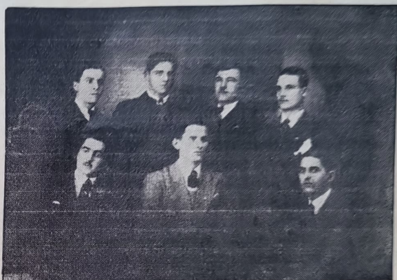
Настоятелството на секцията

Съ общи усилия бѣ основана и библиотека, която е добре подредена и която разполага съ едно завидно число прочетни книги изъ македонския въпросъ и отъ чисто наученъ характеръ.