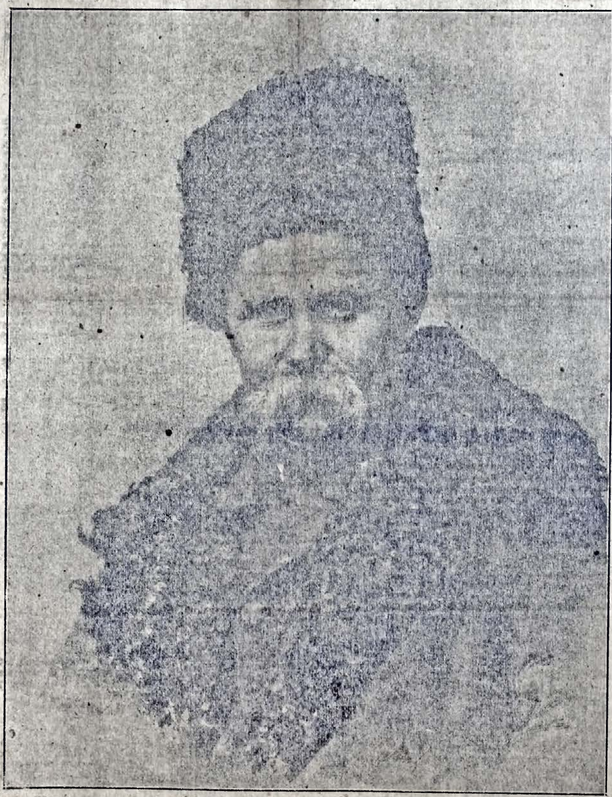
В 100-літні роковини уродин Тараса Шевченка.

РІК XXII. Джерзи Сіти, Н. Дж., четвер, 5-го марта 1914. Ч. 10. | 1 | VOL. XXII. Jersey City, N. J., Thursday, March 5, 1914. N. 10.