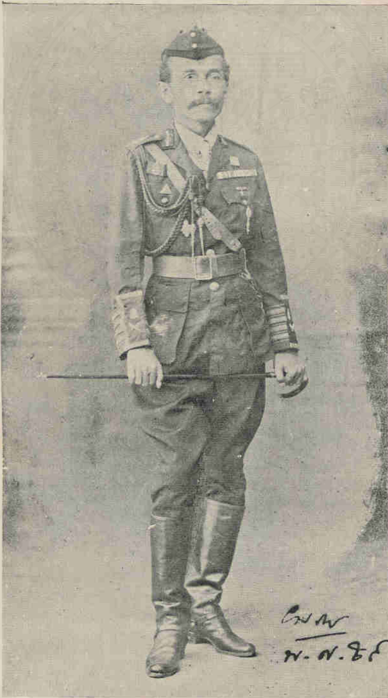
05/11/2565 ถ่ายภาพเมื่อเป็นนายพลเสือป่า ผู้บัญชาการเสือป่า รักษาดินแดนนครกรุงเทพฯ (พ.ศ. ๒๔๕๘)