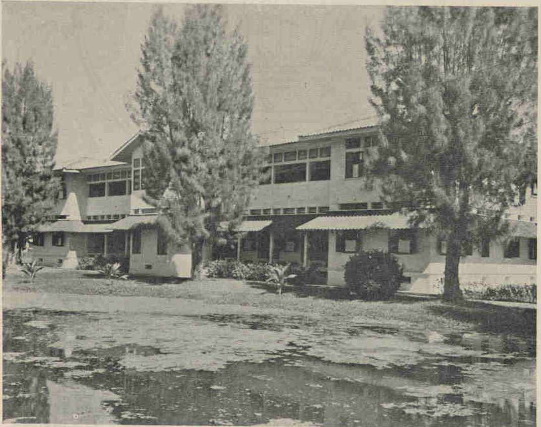
“โรงพยาบาลเจ้าพระยามรราช (ปิ่น สุขุม)” ซึ่งท่านเจ้าพระยามรราช ได้สร้างขึ้นในบริเวณโรงพยาบาลจุฬาลงกรณ์และทำพิธีเปิดเมื่อ พ.ศ. ๒๔๖๕