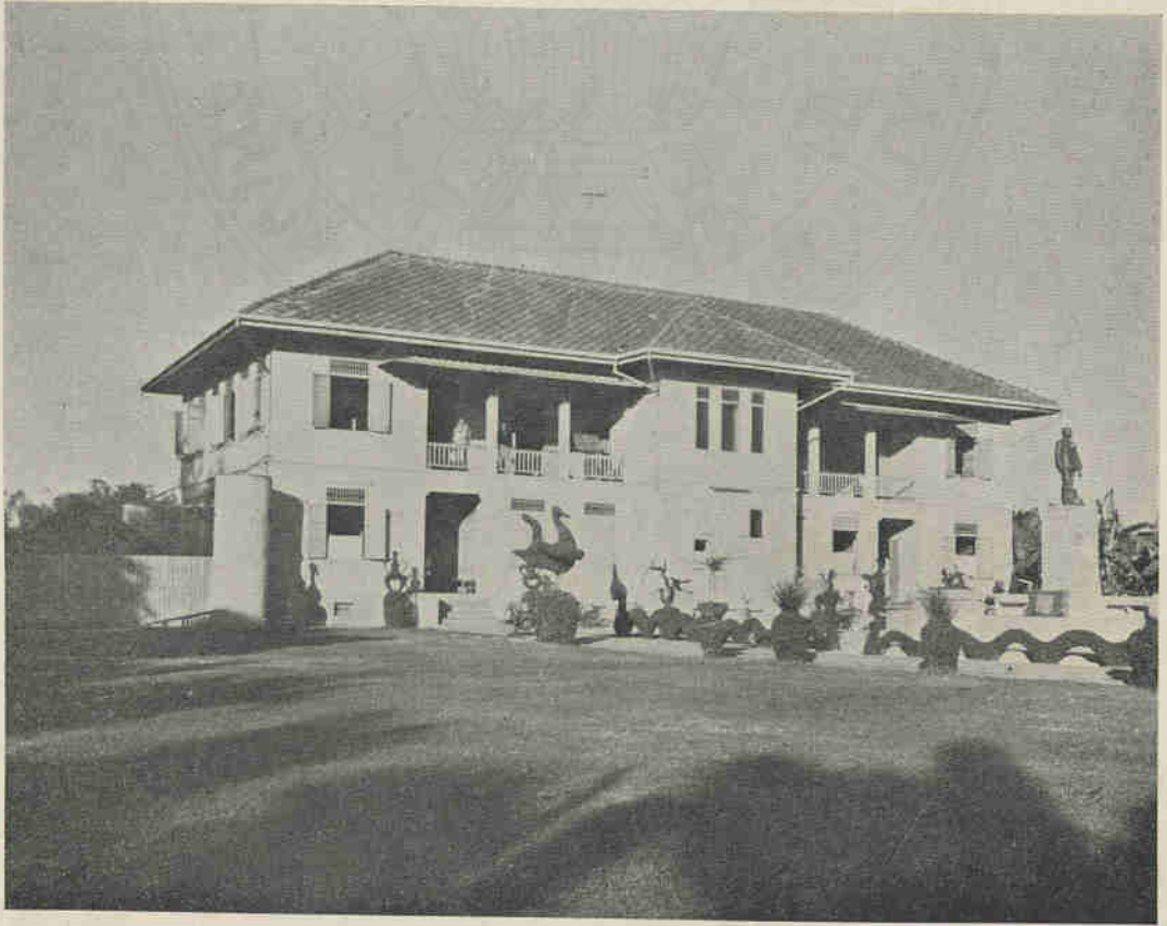
“โรงพยาบาลเจ้าพระยามรราช (บัน สุขุม)” ซึ่งท่านเจ้าพระยามรราช ได้สร้างขนทงหวัดสุพรรณบุรีและไดทาพชเบต เมอ พ.ศ. ๒๔๖๕