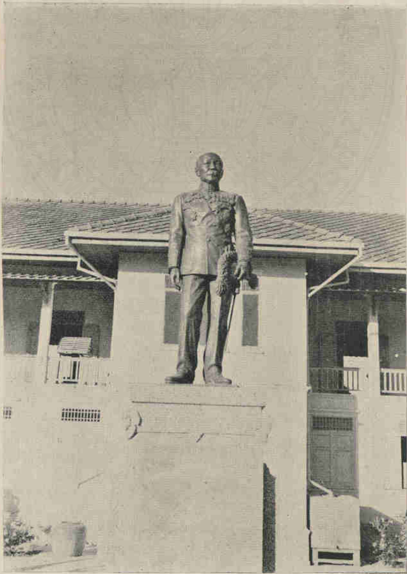
อนุสาวรีย์ มหาอำมาตย์นายก เจ้าพระยายมราช ณ โรงพยาบาลเจ้าพระยายมราช จ.ว. สุพรรณบุรี