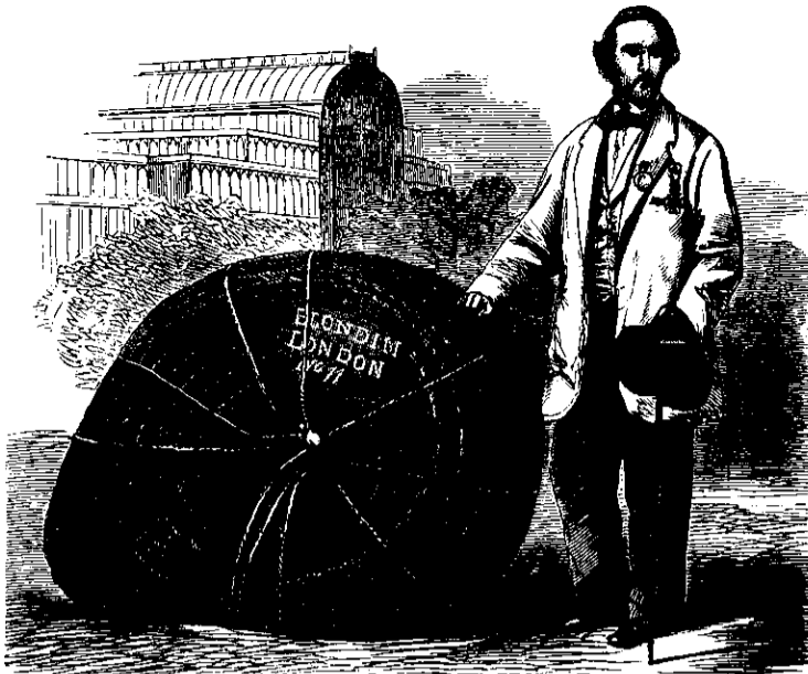
Linedanseren Blondin i London.

Den berømte Linedanser Blondins utrolige Gang over Niagara-Bandsfaldet var dog ikke en amerikansk Humbug! Englands Hovedstad har nu ogsaa været Vidne til hans Præstationer, idet han Løvedagen den 1ste Juni for første Gang optraadte der paa en Line af 320 eng. Fods Længde, som var udsendt i en Høide af 200 Fod. Kl. 4 om Eftermiddagen fremtraadte han ved Enden af Linen og blev modtaget med overordentlig stort Bisald; han var iført en indiansk Høvedingdragt, der var pragtfuldt besat med Perler. Uden at fridte hverken Fødderne eller Linen, som saa mange Konstruere af mindre Berømtbed gjøre, for at lade Publikum sætte sig ind i de mange Farer, der vente dem, kom han paa een gang midt ud