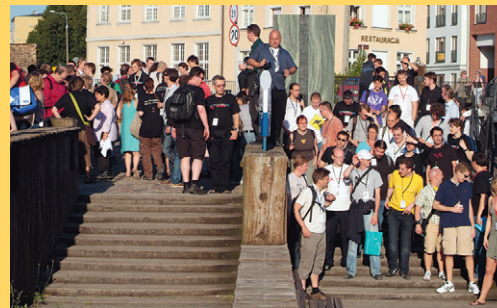
Ralf Roletschek, CC BY SA 3.0