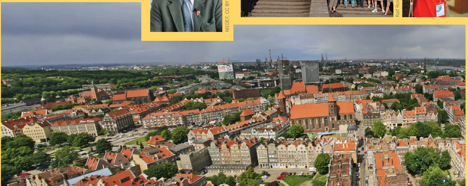
Michał Stupczewski, CC BY SA 3.0