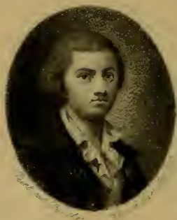
P P' PRUD'HON