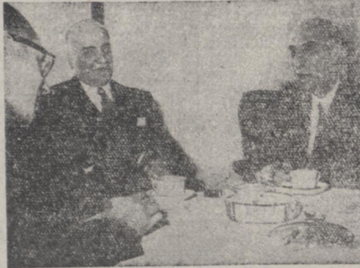
آقایان دکتر مصدق نخست وزیر و هندرسن سفیر امریکا هنگام مذاکره در جلسه ملاقات دیروز

حوادث ناهای که در مناسبات عمومی دولتین ایران و امریکا بوقوع پیوسته است