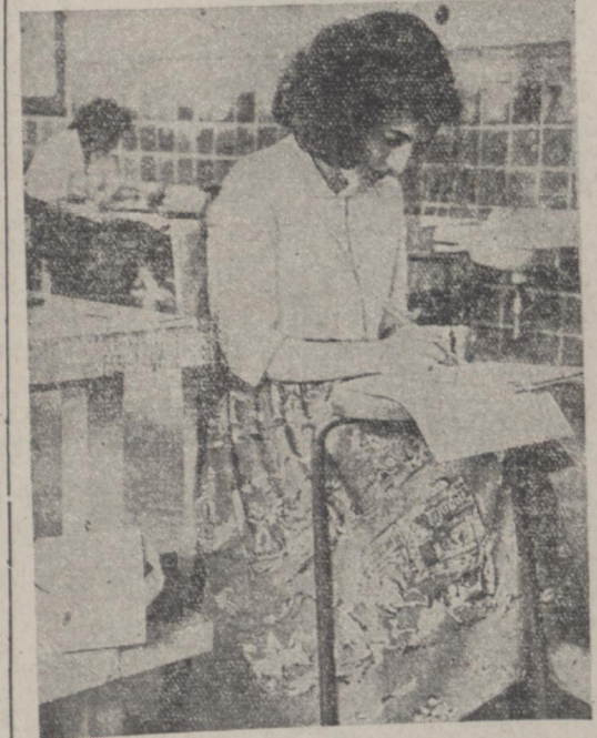
دارطلبان امتحانات ششم ریاضی مشغول نوشتن پاسخ بسئوالات میباشند

کتابخانه ها و موسسات دولتی از مبلغ شصت میلیون دلار تهرانی عایدات فروش نفت بایتالیا نامین و لوازم مورد احتیاج آنها به کار خراجت ایتالیا سفارش داده شود