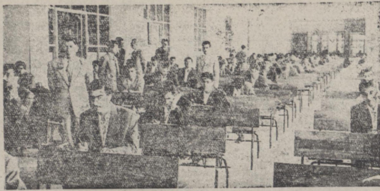
یک قسمت از حوزه امتحانی در دبیرستان نوربخش که امروز مورد بازدید و پذیرفته قرار گرفت

در این امتحانات متجاوز از ده هزار نفر داوطلب شرکت نموده است