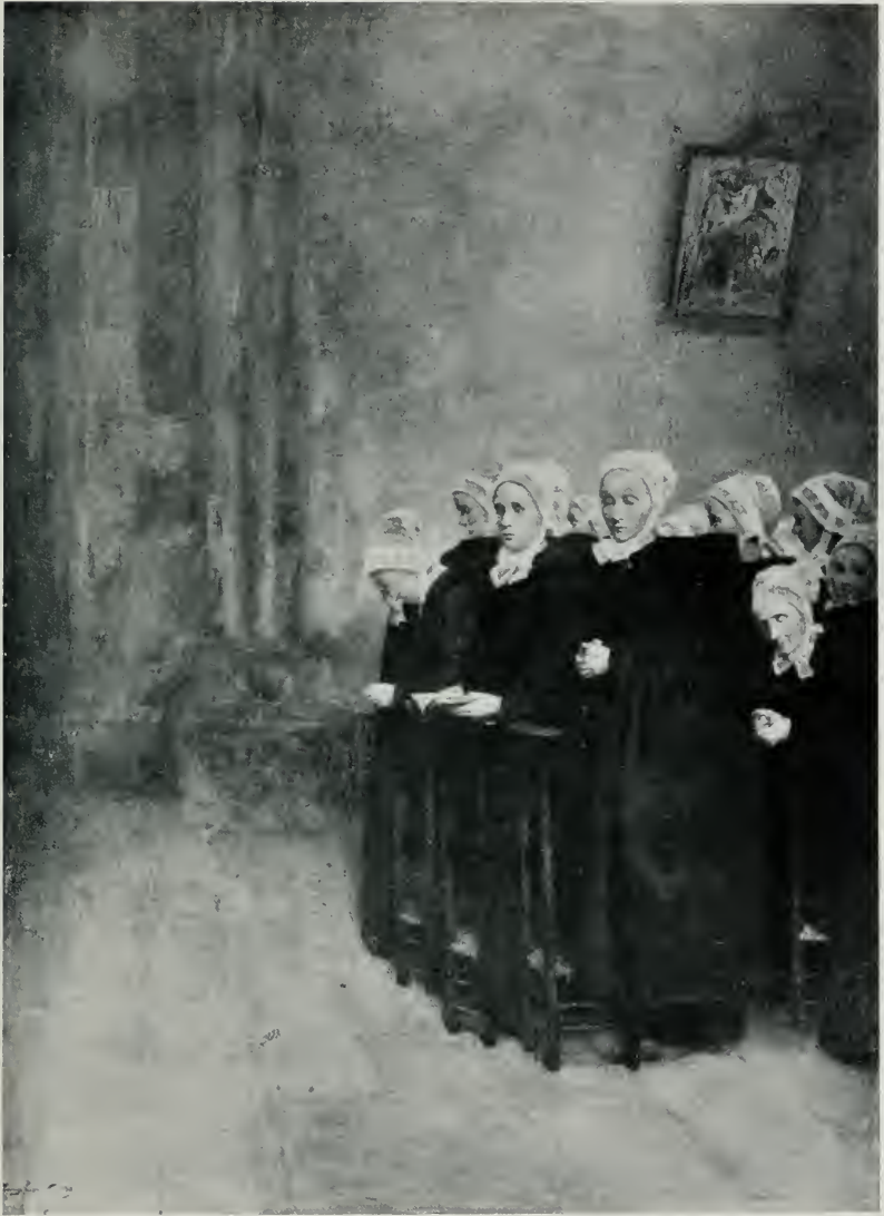
BRETONNES A L'ÉGLISE