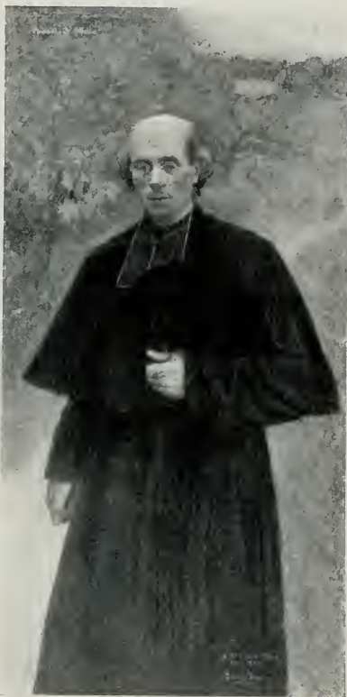
M. LE DOYEN P...

Beaux-Arts. Mais ses parents, gens très sages, ne voulurent pas consentir à ce qu'il se préparât directement et exclusivement à la carrière artistique. Ils entendaient le doter d'un métier qui, proche voisin des beaux-arts, lui assurât, du moins, en cas de déboires, la vie matérielle. Et en 1872, ils le mirent,