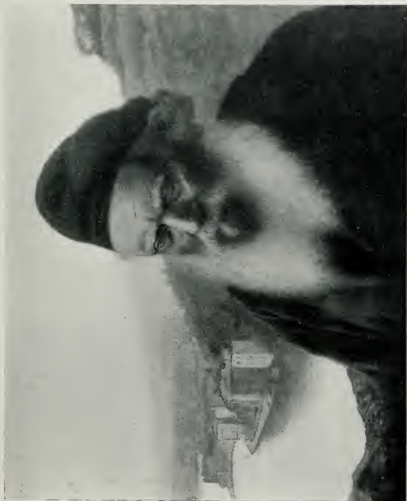
MARIN DE VILLEFRANCHE