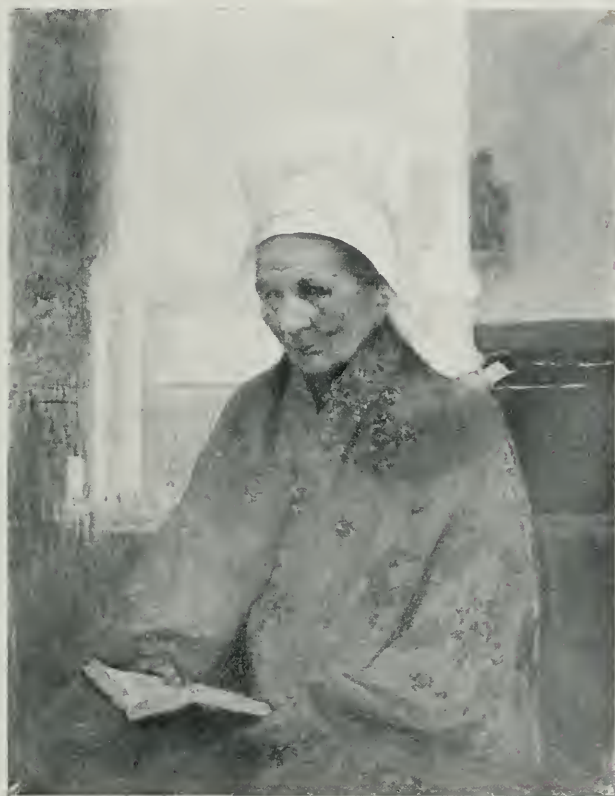
NORMANDE A L'ÉGLISE