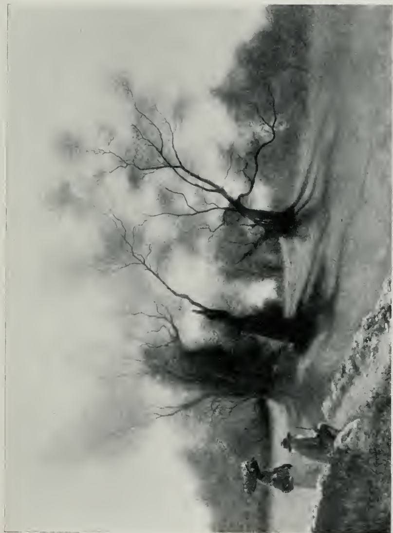
LES OLIVIERS AU CAP FERRAT