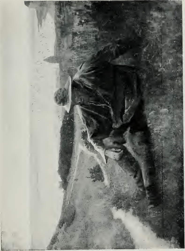
PÊCHEUR DU TRÉPORT