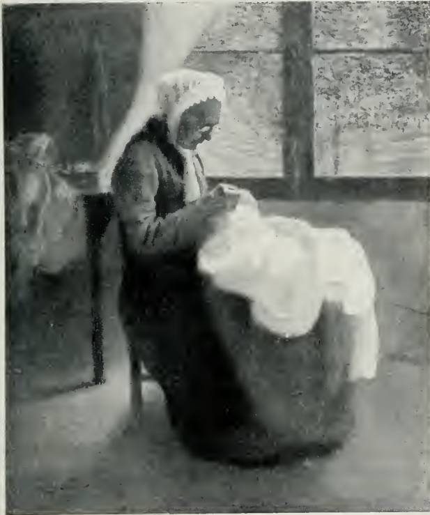
VIEILLE REPRISANT SON LINGE