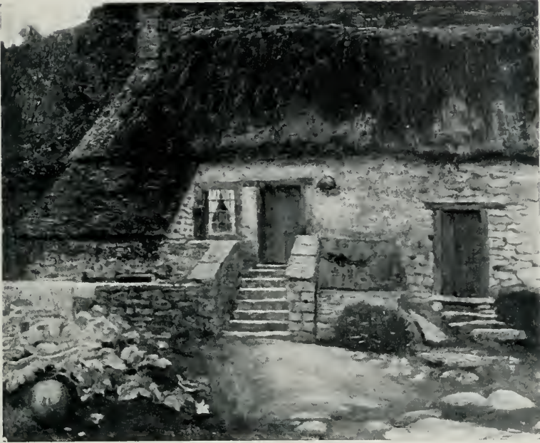
VIEILLE MAISON A VITRA