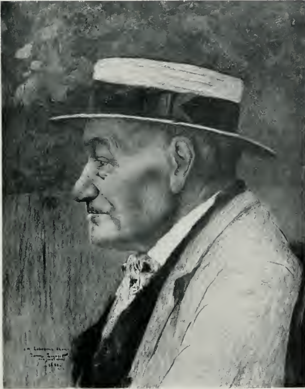
LE PERE LABAUME