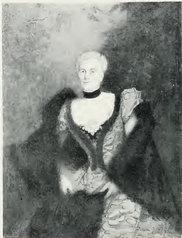
M m e MARIE A...