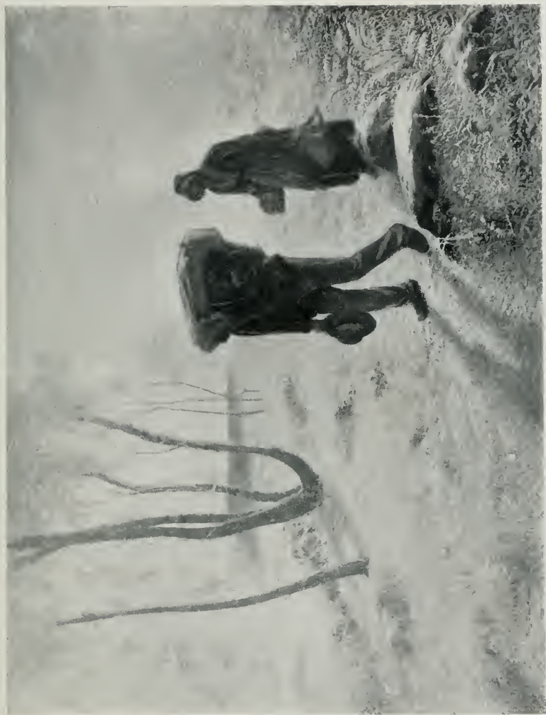
DÉPART POUR LA RIVIÈRE