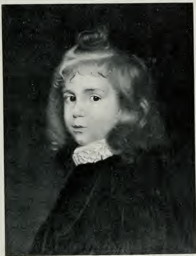
L'ENFANT A LA COLLERETTE (PORTRAIT DE ROBERT L...)