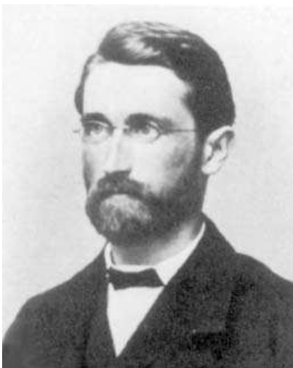
Richard Dedekind (1831-1916)

BEMERKUNG 48.4. Die Mengen A bzw. B heißen auch die Untermenge bzw. Obermenge des Dedekindschen Schnittes. Sie legen sich wegen der Bedingung (2) gegenseitig fest. Jede reelle Zahl z \in \mathbb{R} (und auch jedes Element in einem angeordneten Körper) definiert einen Dedekindschen Schnitt, indem man