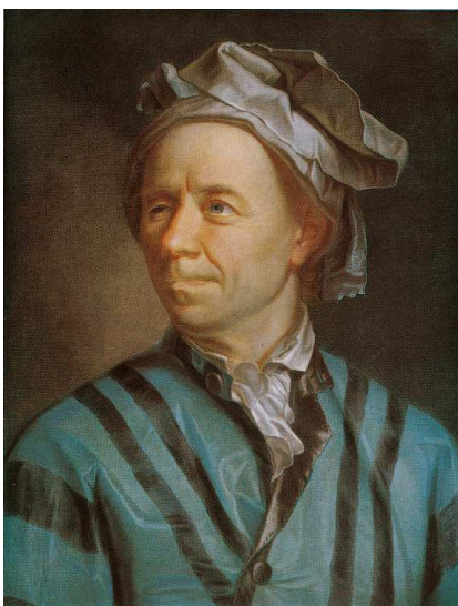
Leonhard Euler (1707-1783)

und konvergieren somit gegen 0. Also liegt insgesamt eine Intervallschachtelung vor. \square