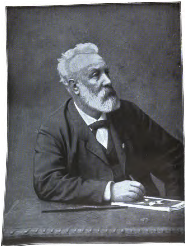
JULES VERNE 1828-1905