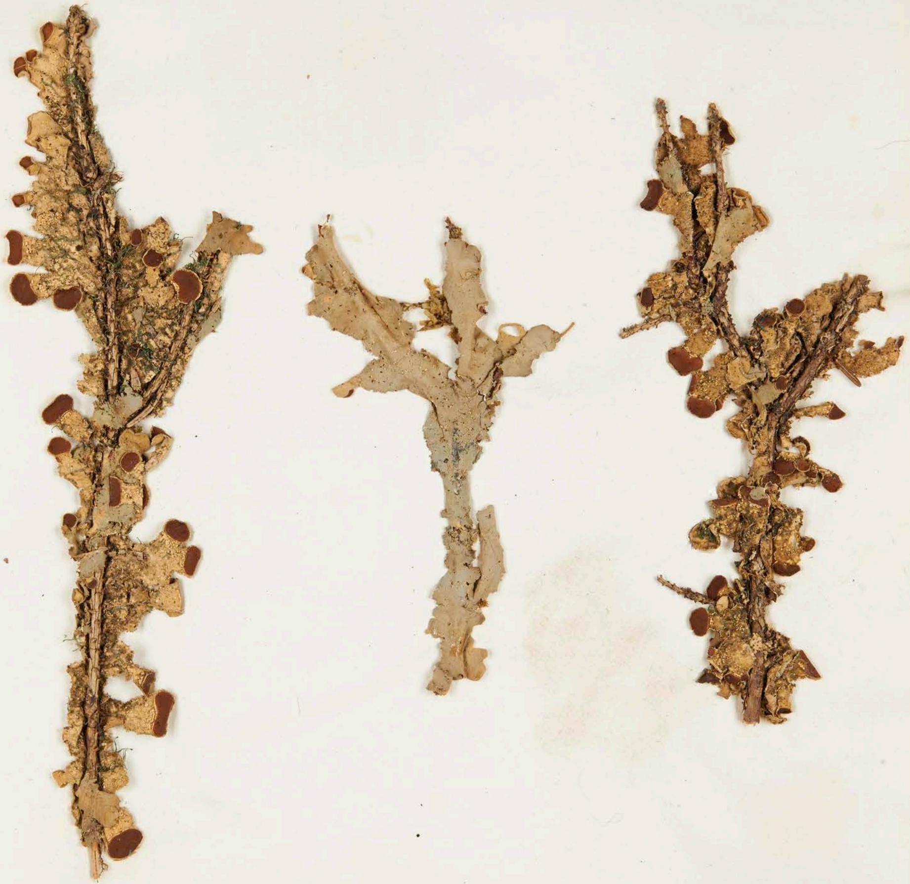
508. Peltigera resupinata \gamma . papyracea . FR. Spicil. p. 270. 560. Ad ramos abietinos locis opacis.