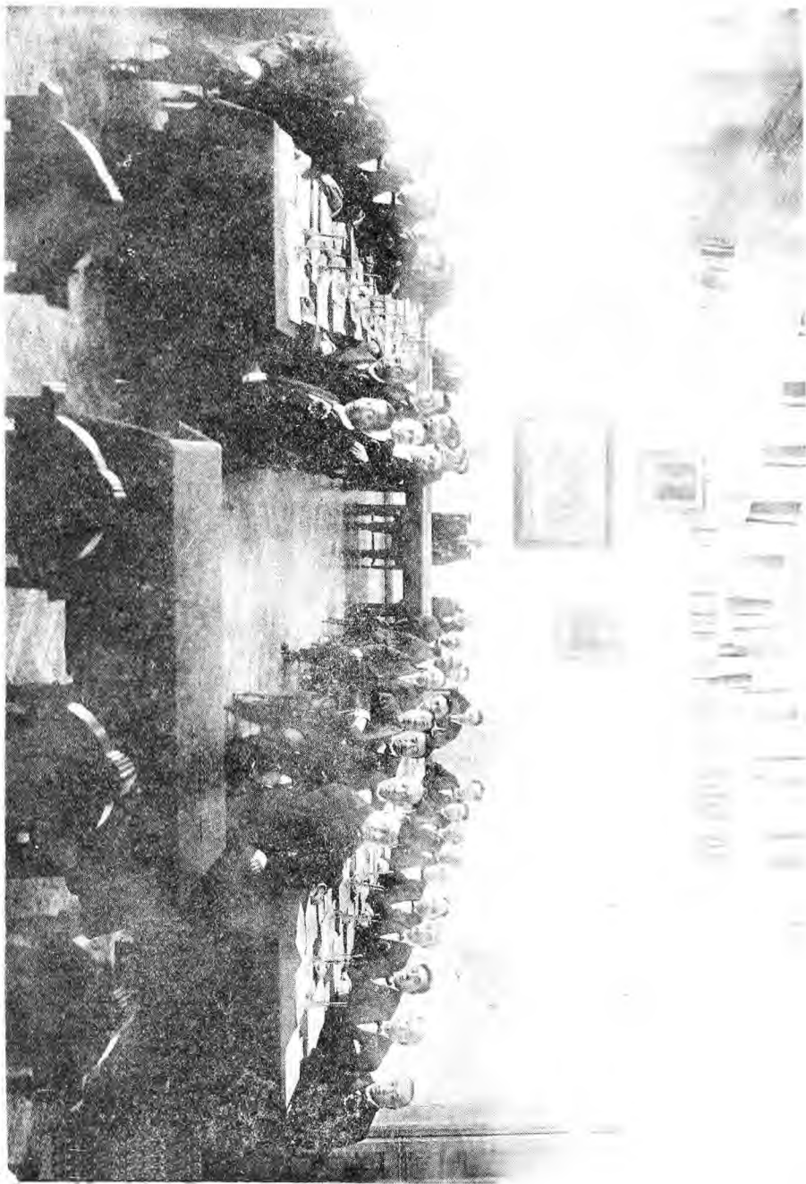
一 影 攝 立 成 會 治 自 市