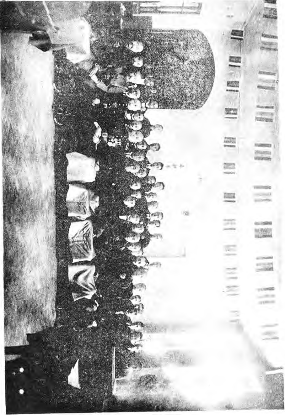
市 自 治 會 成 立 攝 影 二