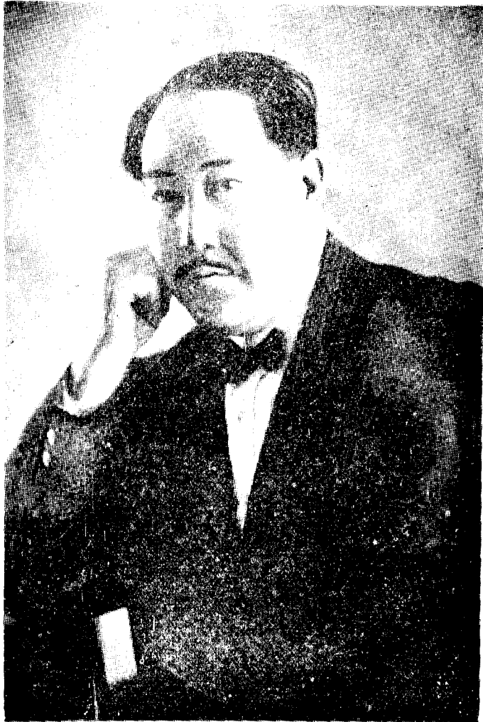
張 會 長