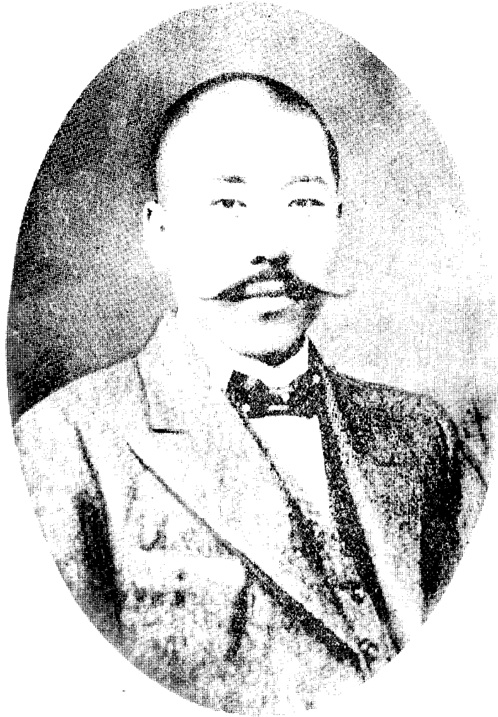
馬 副 會 長