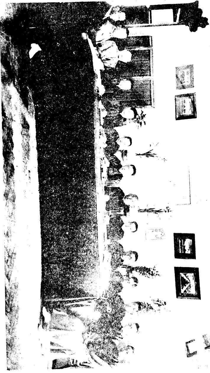
哈爾濱特別自治會評稅委員會全體操演文藝六月