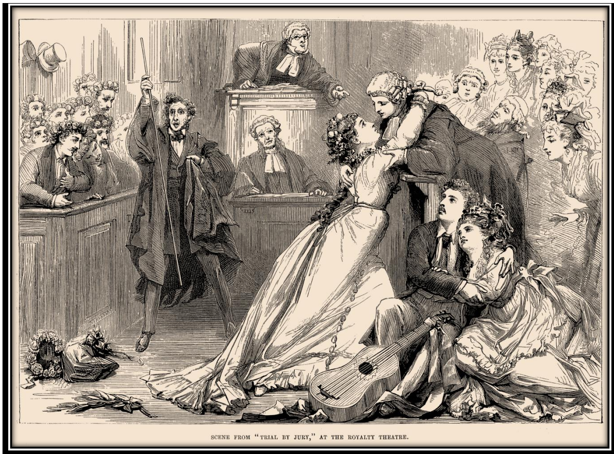
Escena de "Trial by Jury", en el Royalty Theatre.