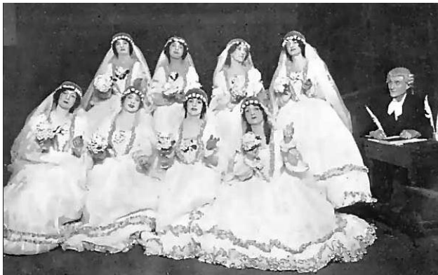
Las DAMAS DE HONOR (1919-1920)