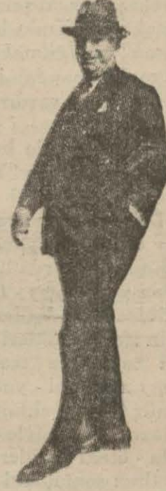
B. Şükrü Kaya

Arttırma ve yerli mallar haftası -nın beşinci günü dolayısıyla İç İşler Bakanımız B. Şükrü Kaya Ankara radyosunda aşağıya koyduğumuz konuşmayı yapmıştır: