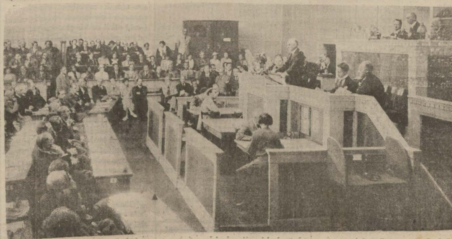
Milletler Cemiyetinin evvelce yaptığı toplantılardan biri.

İngilterenin, avam kamarasının perşembe günkü görüşmeleri esnasında (Sonu 6. inci sayfada)