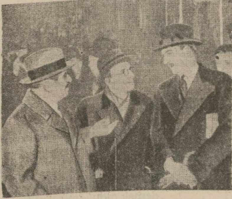
Soldan sağa: BB. Laval, Madariaga, Eden