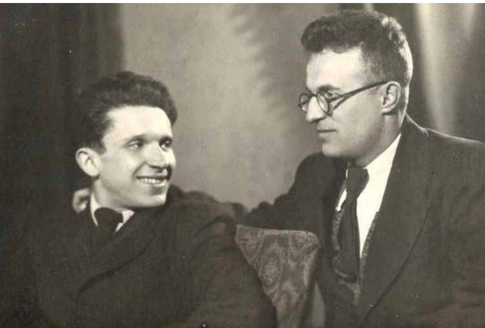
Weinberg en collega componist Sviridov in 1946