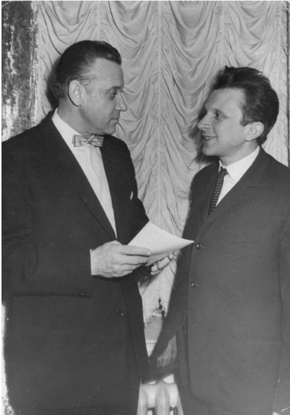
Weinberg met dirigent Kirill Kondrasjin, vroege jaren '60