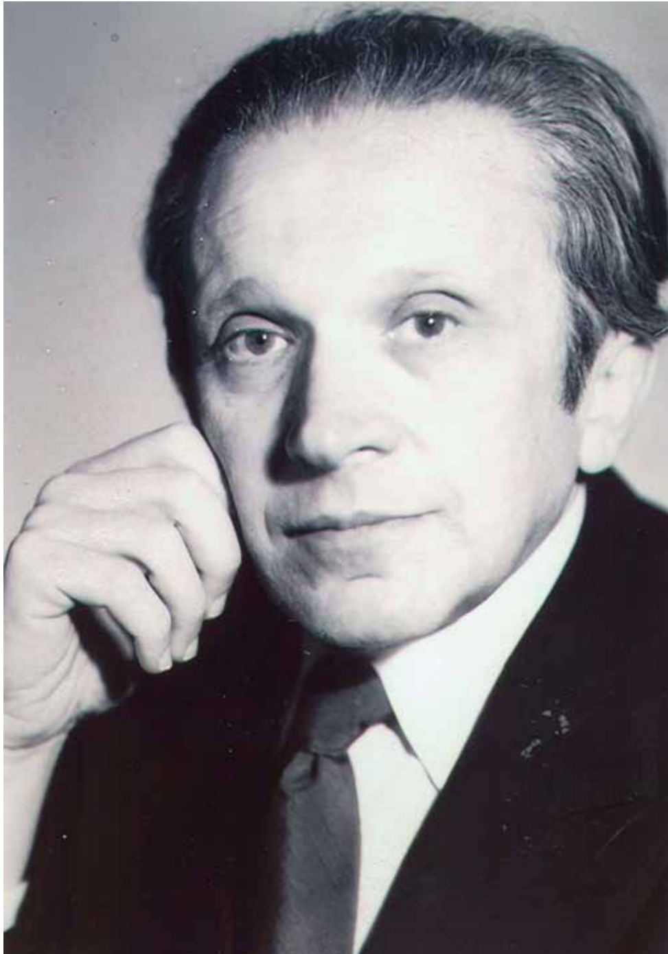
Weinberg in 1983