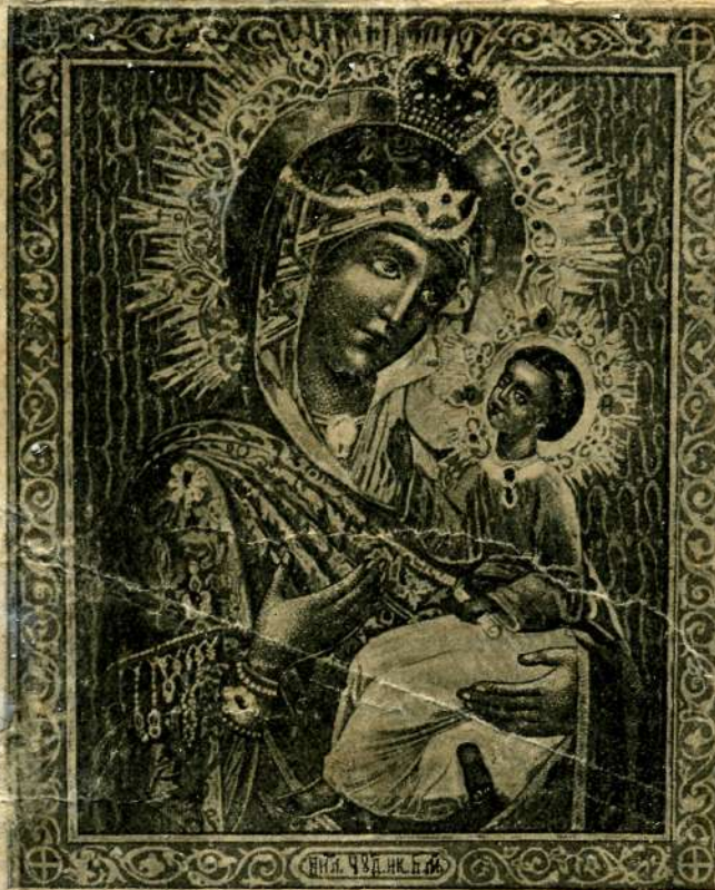
Изображеніе Божіей Матери „Виленской“, находится въ предмѣстѣи г. Вильно, въ мужскомъ монастырѣ. (Явилась 14 апрѣля 1341 года).

Святѣйшая Владычице и Богородице, высшая Херувимъ и честнѣйшая Серафимъ, Богоизбранная Отроковице, всѣхъ скорбящихъ Радосте! подаждь утѣшеніе и намъ, въ скорби сущимъ: развѣ бо Тебе инаго прибежища и помощи не имамъ. Сиди ради надъ нами, таи