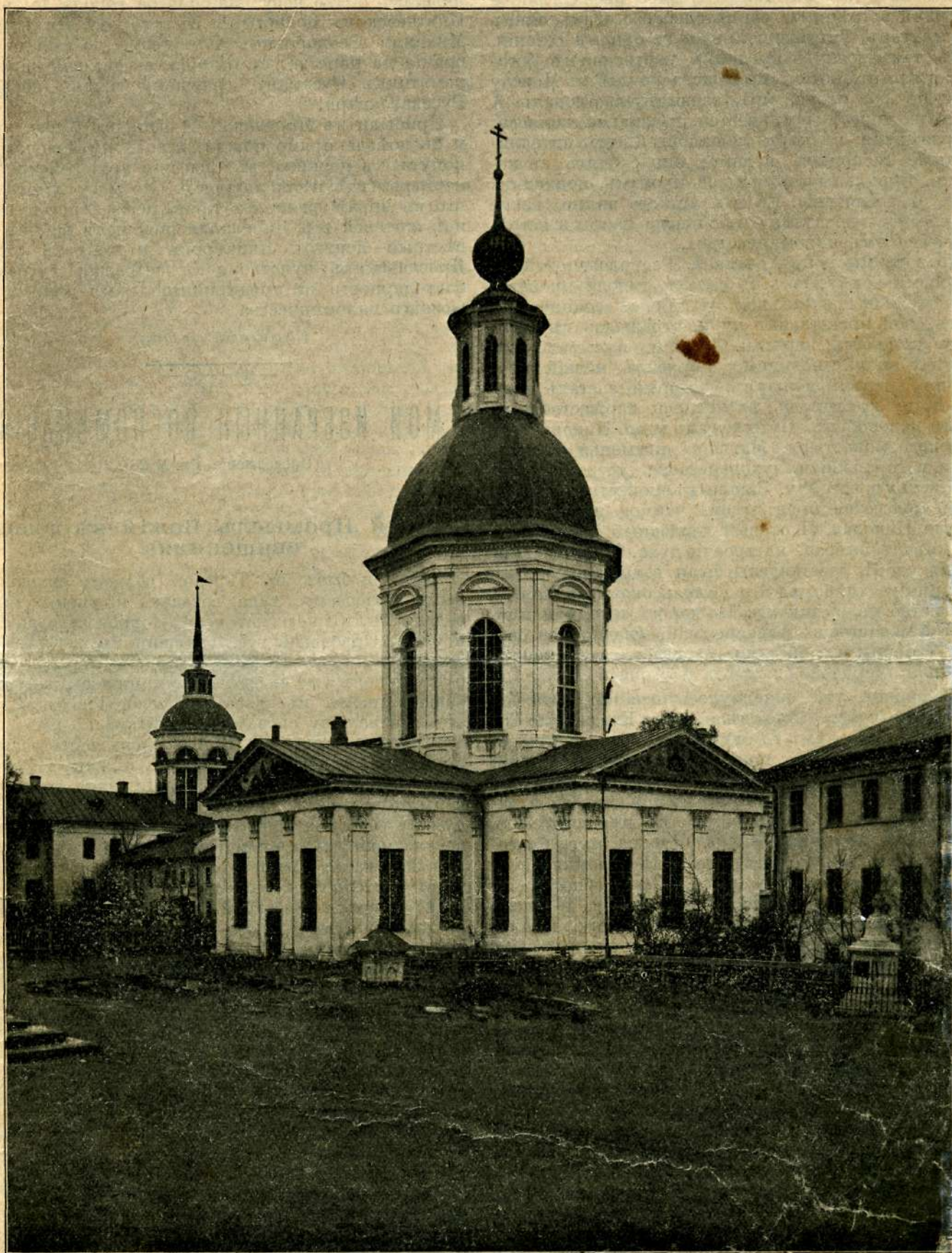
Внѣшній видъ храма Свв. Зосимы и Савватія Соловецкихъ чудотворцевъ, въ Саровской пустыни. (Къ статьѣ „Воспоминаніе о паломничествѣ“).