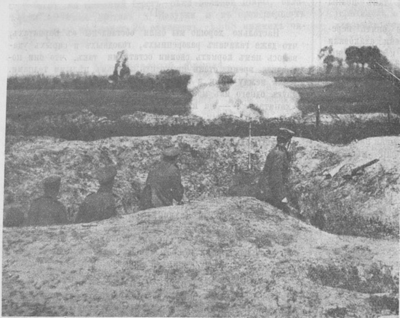
Взрывъ мины.