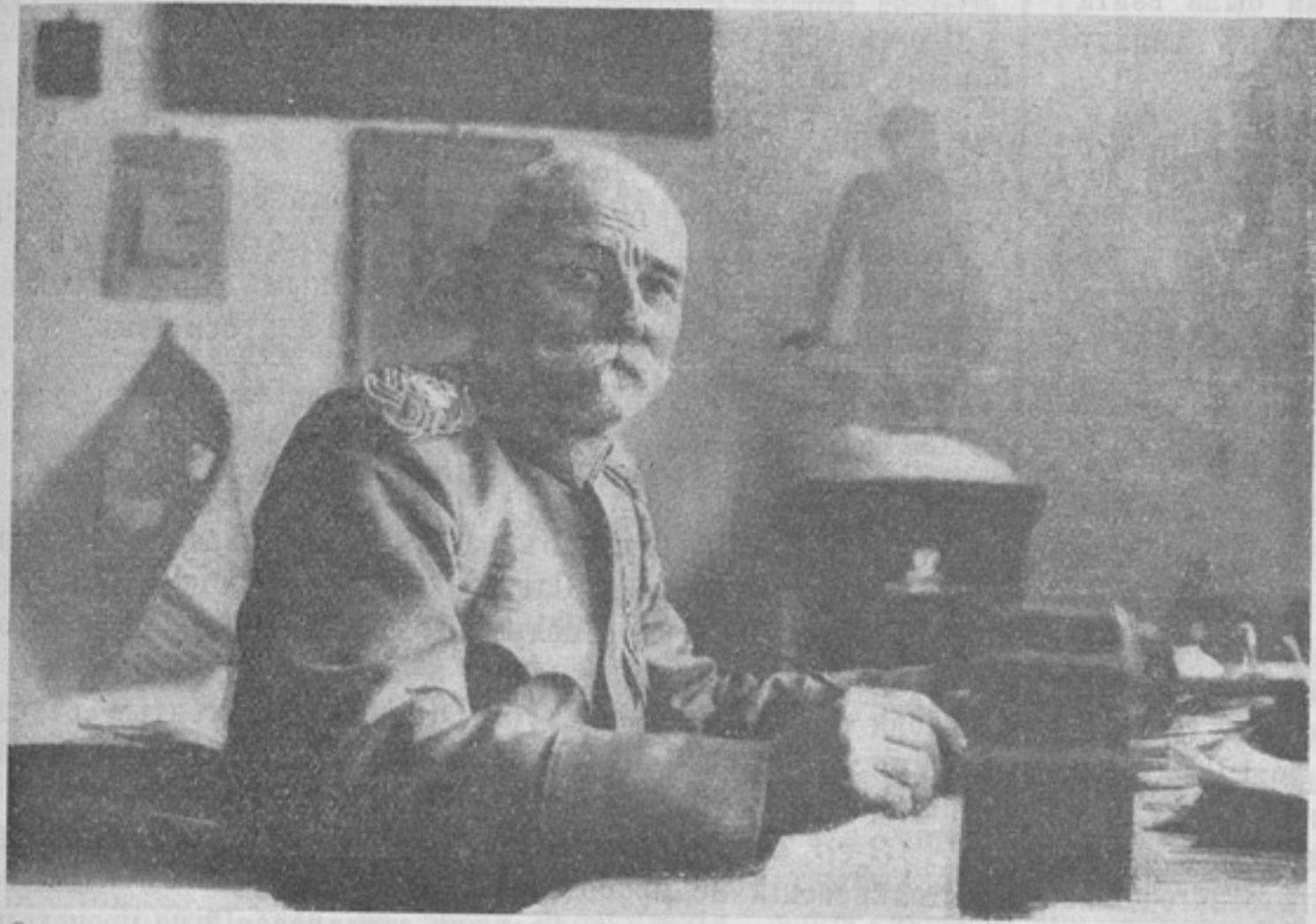
Сербскій король Петръ.

8-го октября. Въ рижскомъ районѣ, на фронтѣ нижней Аа, шелъ огневой бой. Наступленіе германцевъ восточнѣе с. Олай (на Митавскомъ шоссе) было отбито. На фронтѣ къ востоку отъ Олая — непрерывная канонада. На окраинѣ Митавы наши «Пльи Муромцы» сбросили нѣсколько десятковъ бомбъ. Причинили большія разрушенія на желѣзной дорогѣ и въ складахъ противника. Въ районѣ Олая нашими войсками сбитъ нѣмецкій аэропланъ. Летчики разбились на смерть. Въ районѣ д. Плаканенъ, восточнѣе Олая,