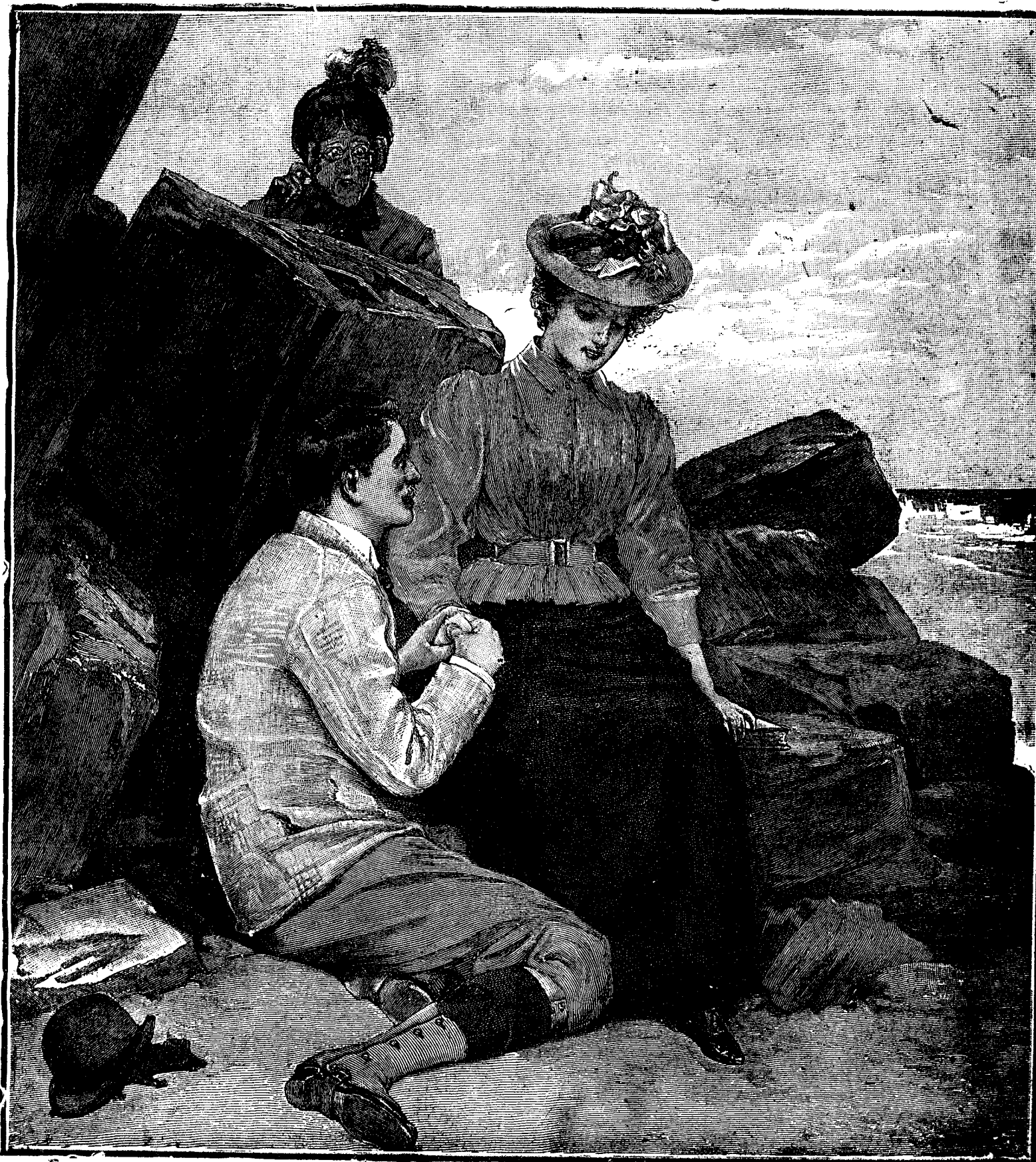
P E M A L U L M Ă R E I .