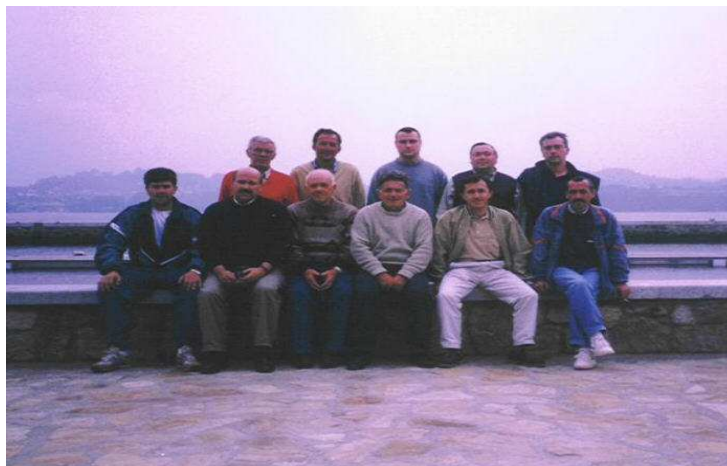
Primeira xunta directiva (1998)

As infraestructuras do Porto de Miño ampliáranse nos anos anteriores, se ben eran moitas as súas carencias, tal como a falta dunha entidade que agrupara ós usuarios do porto, e tomara a iniciativa de cara á xestión dos embarcadiros, e ás peticións de melloras dos servizos para as embarcacións deportivas.