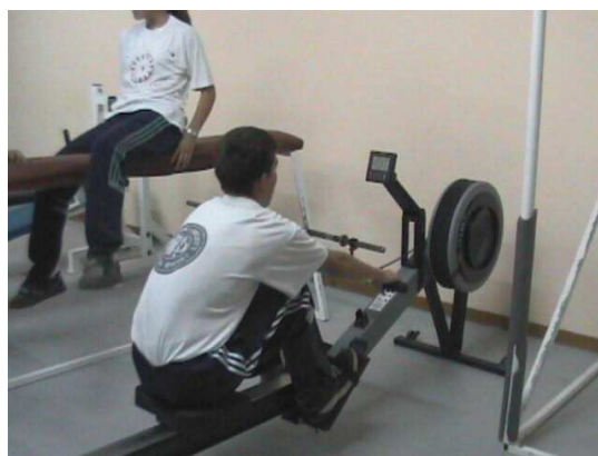
Ximnasio da instalación deportiva