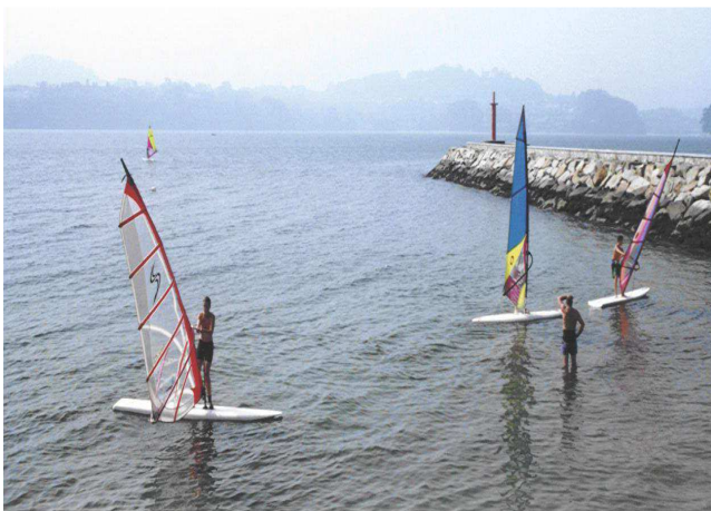
Curso de iniciación ó wind-surf