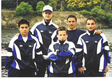
Infantís e técnicos, 2001.