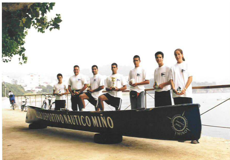
Deportistas de remo galardoados na tempada 2001

Despois de tres tempadas, hoxe temos catro bateis e unha trainerilla. Esta última recentemente adquirida e que nos posibilitará competir noutra nova modalidade.