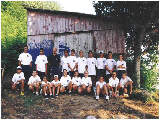
Piragüismo (1999), co galpón de fondo.