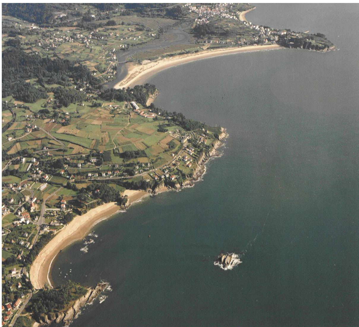
Vista aérea da costa miñense, praias de Perbes, Miño e A Ribeira