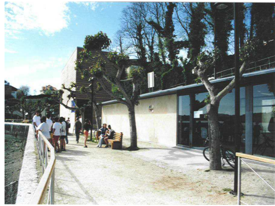
Instalación deportiva do Porto de Miño (2001)