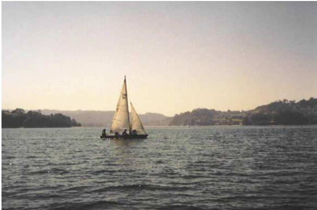
Escola de iniciación á vela 2001