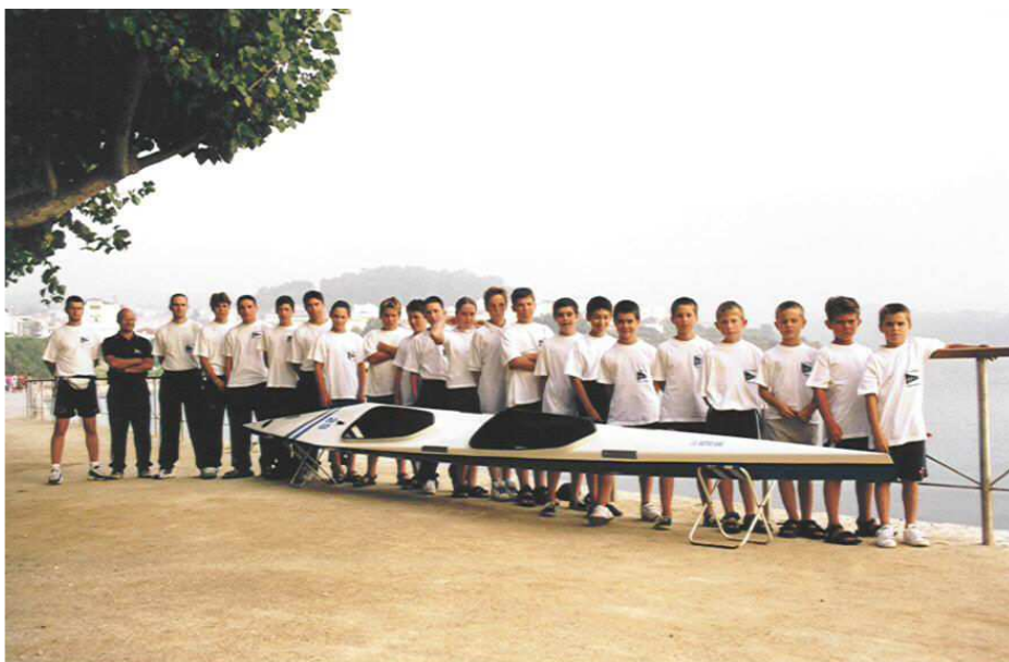
Equipo de piragüismo, tempada 2001

A xunta directiva neste ano seguiu co seu programa de adquisición de novo material, embarcacións, remos e complementos. E agardamos que cos beneficios da nova instalación deportiva, do seu adestramento diario e da preparación física específica, poidamos chegar a estar na élite do piragüismo galego.