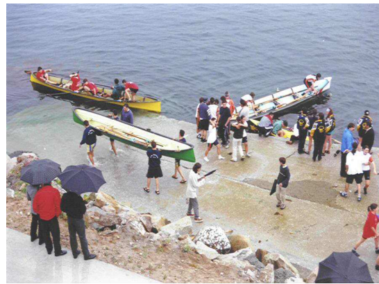
Campionato de bateis, Burela (1999)