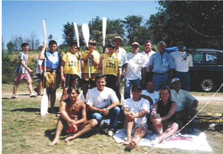
Primeira participación en probas de piragüismo. Muiños (1998)

Neste ano ano a Deputación da Coruña por medio do Plan 2000 de Deportes aproba a convocatoria de subvencións ós concellos da provincia para a solicitude de instalacións de remo e piragüismo, e o club ve nela a oportunidade histórica que non se debe de deixar pasar, e así entabla as primeiras conversas cos distintos grupos que conforman a Corporación Municipal para a solicitude desta instalación, e o concello sensible á nosa problemática e identificado cos nosos intereses acorda por unanimidade s súa solicitude. E iníciase unha nova etapa que remata neste ano 2001, coa súa inauguración e o convenio de cesión a prol do Club Deportivo Náutico de Miño.