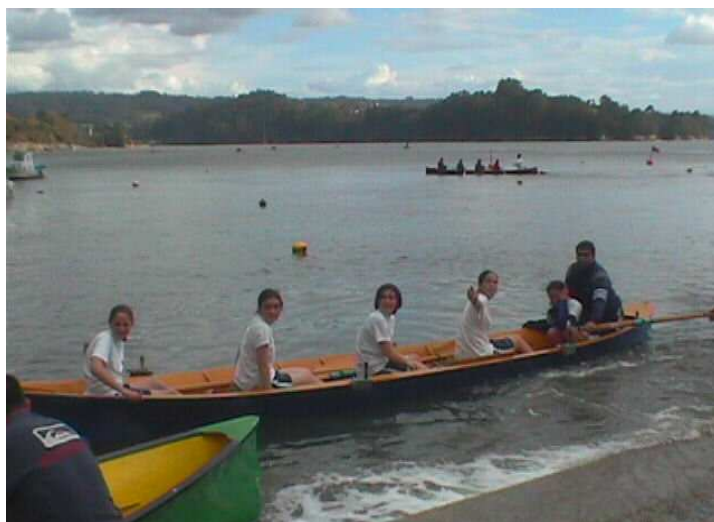
Equipo feminino de remo

Para poder ingresar na sección de remo é preciso ser socio ou beneficiario, ter unha idade mínima de 12 anos, saber nadar, e contar coa autorización paterna no seu caso. O prezo para a tempada 2002 será de 32€, e no que van incluídos o seguro, licencia federativa, material, viaxes ás probas, uso ilimitado do ximnasio, e asistencia ás actividades que se programen para eles.