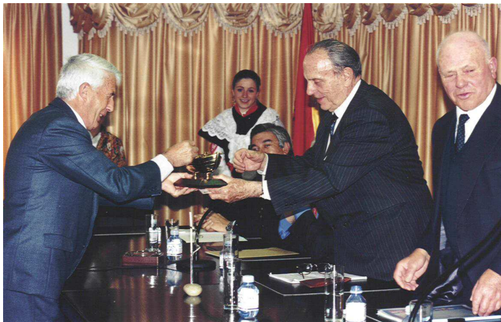
Acto de entrega do nomeamento de socio de honra a D. Manuel Fraga Iribarne (1998)

De seguido e nos primeiros meses de 1998 créanse as seccións deportivas de remo e piragüismo, e a asemblea xeral de xaneiro do mesmo ano acorda a proposta de nomeamento de Socio de Honra a prol de D. Manuel Fraga Iribarne, en consideración ós seus moitos méritos na defensa e promoción de Miño.