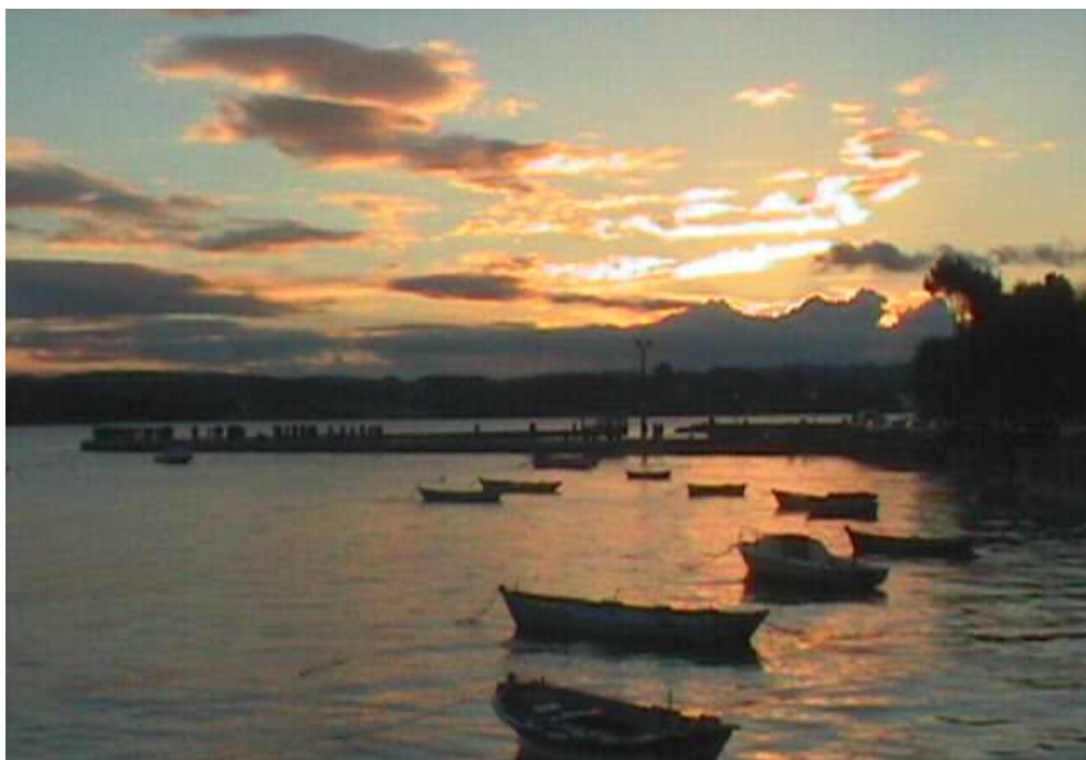
Posta do sol no Porto de Miño