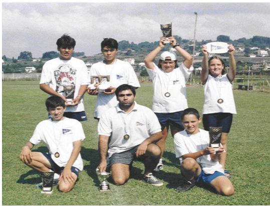
Festa do fin da tempada 2000, galardoados.