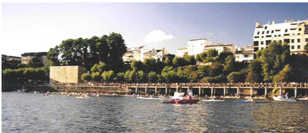
Porto de Miño, proba do G.P. Piragüismo, agosto 2001