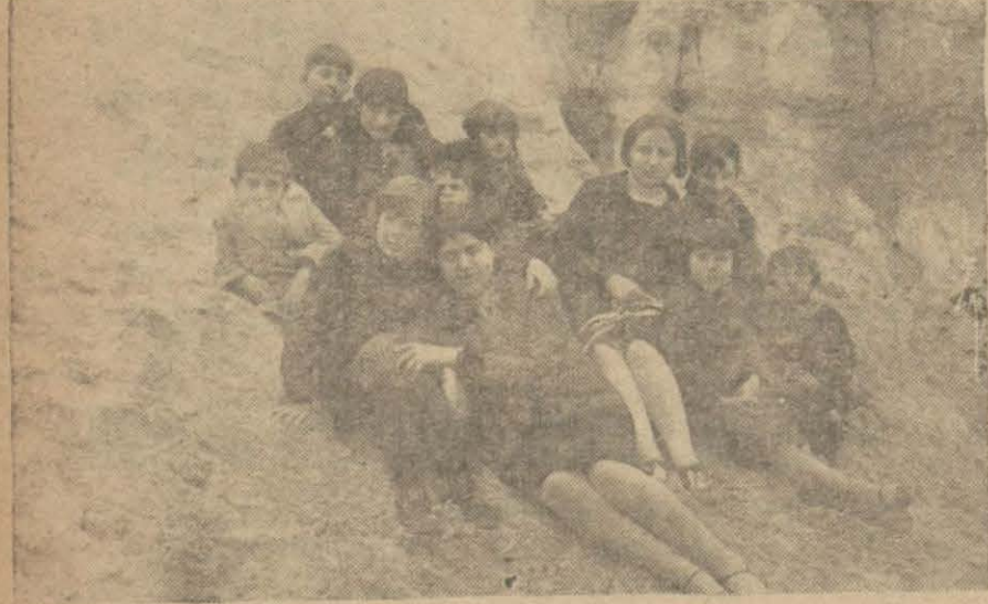
Çorluda ilk mektep muallim ve talebeleri bir tenezzüh esnasında