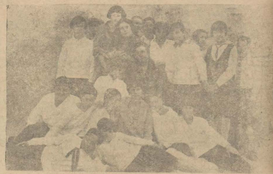
Edremitte Cumhuriyet mektebi talebe ve muallimleri

Bir apartıman kiralıkta Beyoğlunda Aleon sokağında Olivo apartmanın 10 nümerosuna müracaat