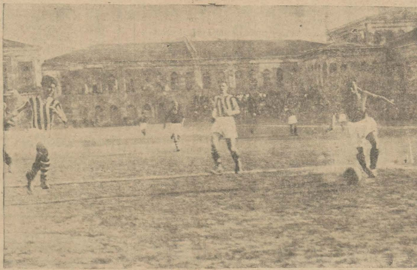
Dün Taksim stadıyunda Fenerle Beşiktaş takımları karşılaştılar. Fenerin galibiyetile neticelenen maçtan bir enstantane

Üsküdar hukuk hakimliğinden; Üsküdar'da ihvanîye köprüsü konak sokağında 10 numaralı haneye mukim memduha hanım tarafından mezkûr hanede sakin iken halen ikametgâhi meçkul Salih bey aleyhine ikame eylemiş boşanma davasının muhakemesinde müddei aleyhine evli-