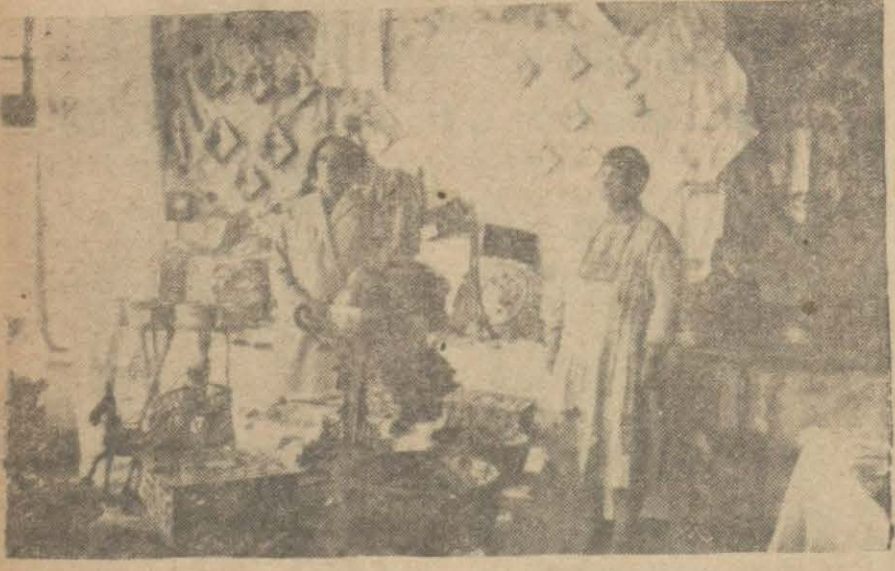
On beşinci lık mektep talebesi, muallimlerinin nazareti altında bir el işleri sergisi vucuda getirmiştir.