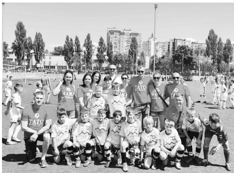
Інф. Макарівської селищної ради

Дякуємо спортсменам за чудові ігри, а вболівальникам за підтримку. Крокуємо до нових перемог!