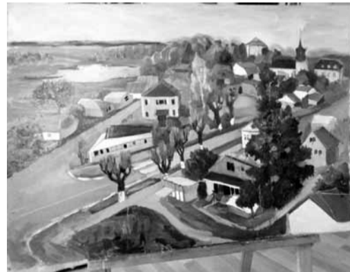
Олександра Сидорець «Макарів з висоти пташиного польоту».