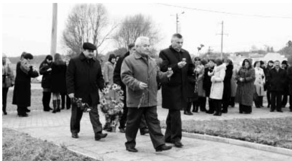
День пам'яті жертв голодомору і політичних репресій вшанувала Макарівщина. Квіти до пам'ятника жертвам голодомору та політичних репресій у райцентрі поклали керівники райдержадміністрації і її відділів, районної та селищної рад, запалили свічки та хвилиною мовчання пом'янули безневинно убієних земляків у 1932-1933 роки.

Прийміть же найкращі побажання здоров'я, успіхів, благополуччя, довголіття, щастя, добра і всього найкращого.