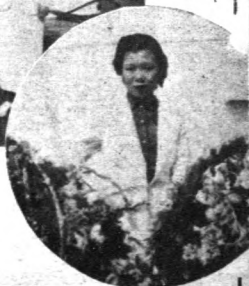
留美女星韋劍芳抵港之時之情形