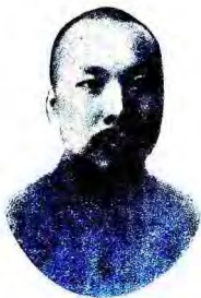
德培朱揮指總軍翼右