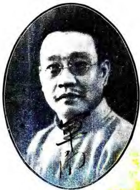
國 民 政 府 主 席 譚 延 闓