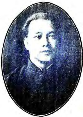
總 黨 代 表 汪 兆 銘