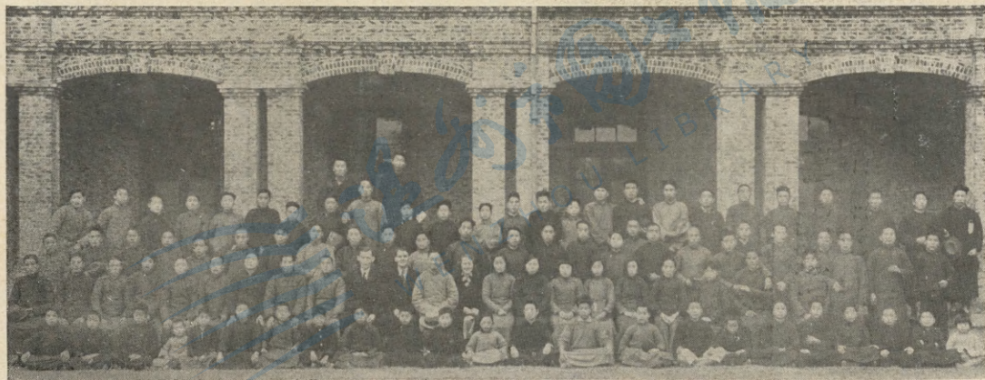
(址舊學中文藝州溫)