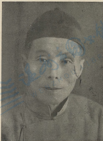
師 牧 卿 冕 范