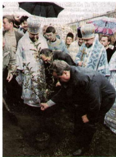
Рости, дерево, під високим ніжинським небом!