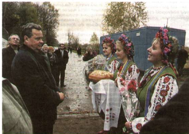
Хліб-сіль від борзенців.