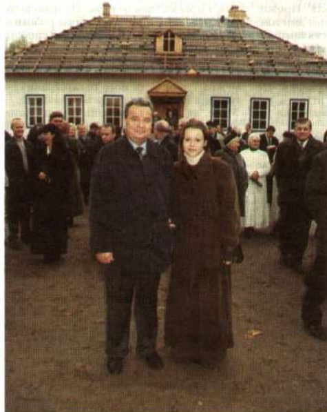
Біля хати-музею П. Куліша в Мотронівці.