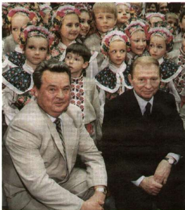
Разом із майбутнім чернігівського краю. Президент України Л.Кучма та Голова Верховної Ради України І.Плющ

Рада товариства "Чернігівське земляцтво" в м. Києві