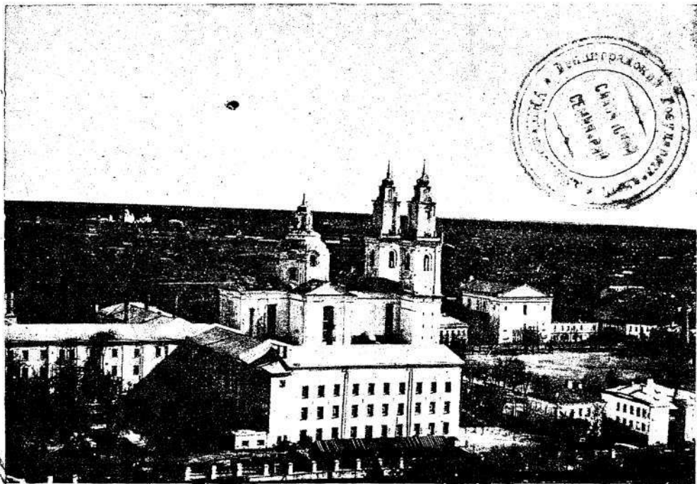
Полацк. Від з аеропляну.