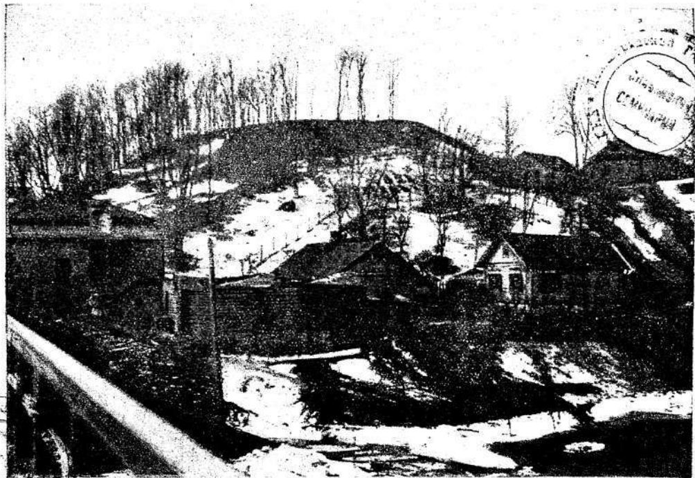
Полацк. Цытадэльны вал. XVI ст.