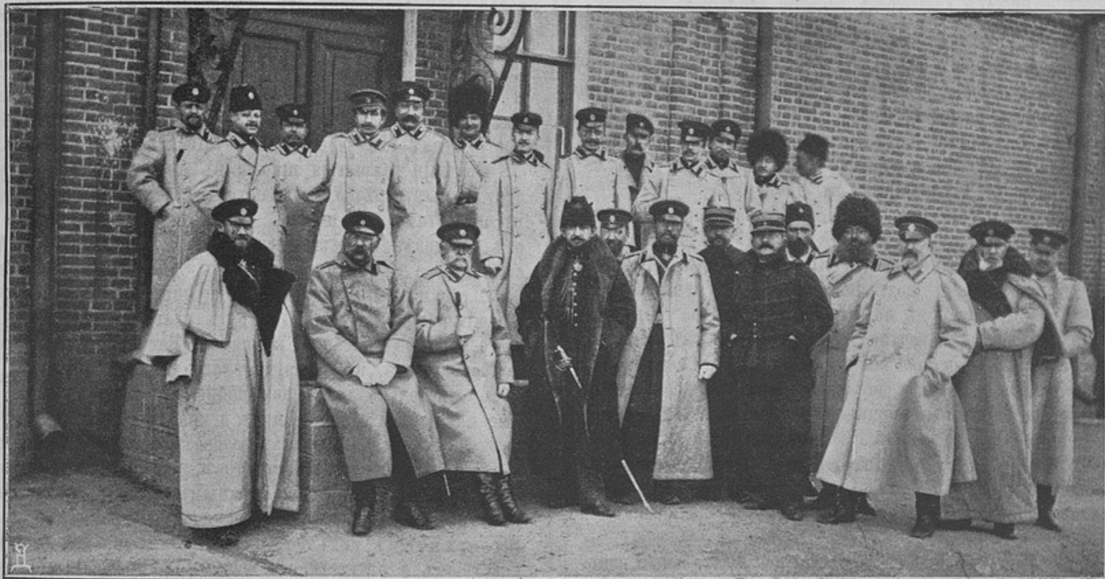
Полковникъ Маршанъ въ Никольскѣ-Уссурійскомъ (къ корреспонденціи «Никольскѣ-Уссурійскій»).

Вытекая изъ необходимости неотвлеченія строевыхъ воинскихъ чиновъ отъ ихъ прямыхъ обязанностей, институтъ денщиковъ въ то же самое время явился институтомъ военной