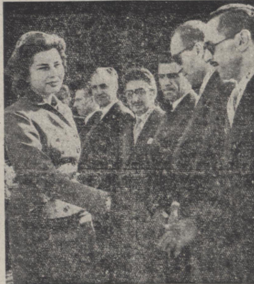
علیاحضرت ملکه ثریا پهلوی در فرودگاه مهر آباد افراد خاندهان بختیاری را مورد مرحمت قراردادند

امروز آقای اخوی وزیر داد کسری درباره موضوع هنوز تدانیان بخیر نگارما گفت : چون اخیرا برده زندانیان در زندانها افزوده شده و وضع زندان ناگوار گردیده است و در نظر گرفته شد کمیسیونی برای رسیدگی به وضع زندانیان تشکیل شود و پرونده کلیه آنها معالنه گردد . نظر اصلی اینست که از طرفی نسبت بعضی از زندانیان ارفاقهائی بشود و عده ای دیگر که کارشان بدون رسیدگی مانده تکلیفشان تعیین گردد . بقیه در صحنه دوم