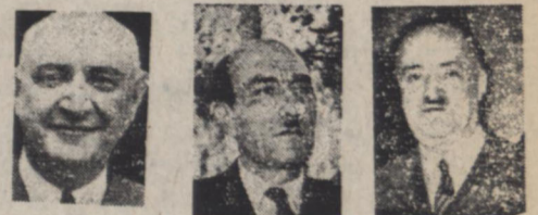
رئیس تهرانی فرور

در کشورهای امریکا، فرانسه، بلژیک، عراق، سوئیس سوئد تعیین شدند