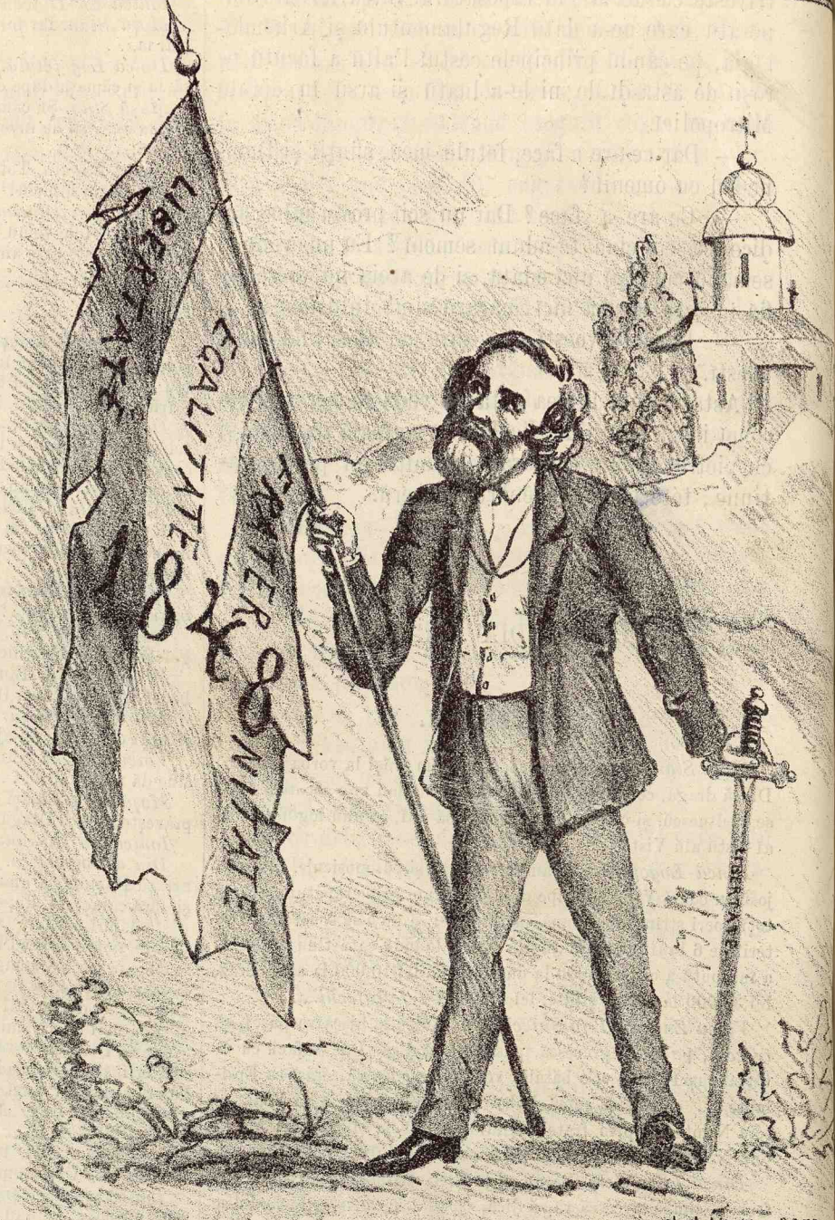
În dar am luat, în dar dăm. —