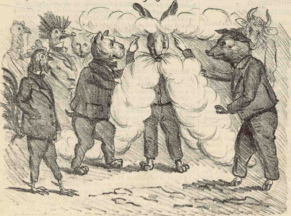
Epurele: — Uitați-vă! din capul meu ese spontaneitatea și ideiele necugetate. — Toți. — Se traiască ideiele necugetate și spontaneitatea! — se se adopte ca principii care se se seriă pe stindardul nostru. —