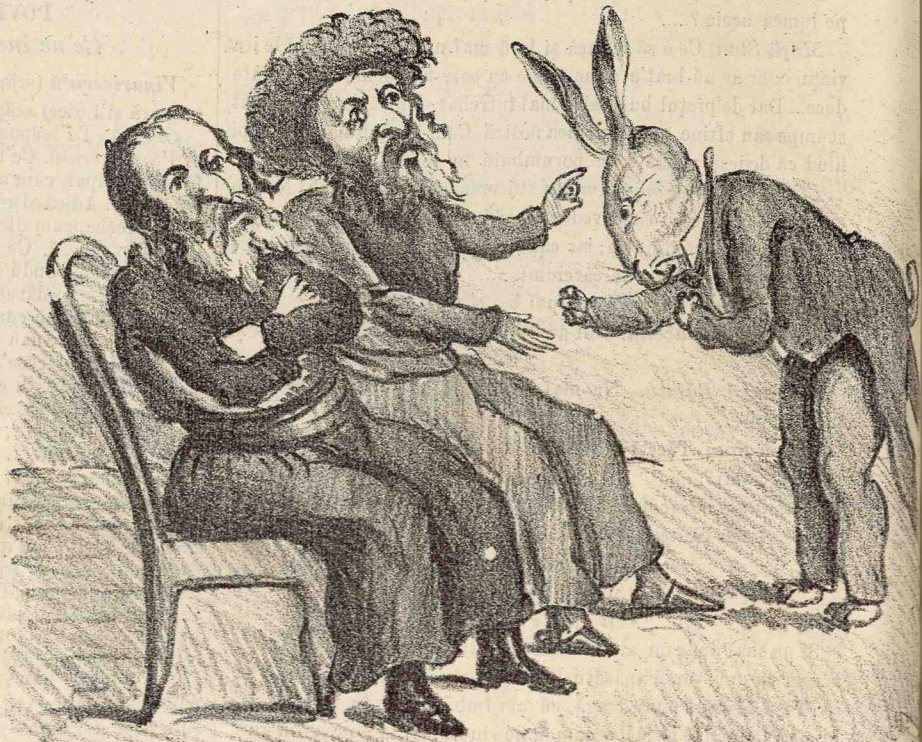
Epurile: Dacă ve-ți face prin plocone găste ca acele ce-mi ați mai dat se fiu alesu de deputatu, vă promitu ca în camera viitoare se facu a se da drepturi.