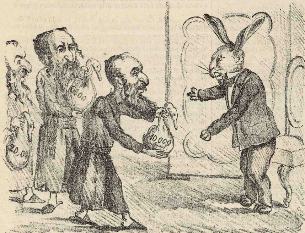
Evrei: — Dute la București și se dai jos de la Ministeriu pe liberali că ți vomu mai da pe urmă și alte găste. — Vă promitu a merita această făgăduială.