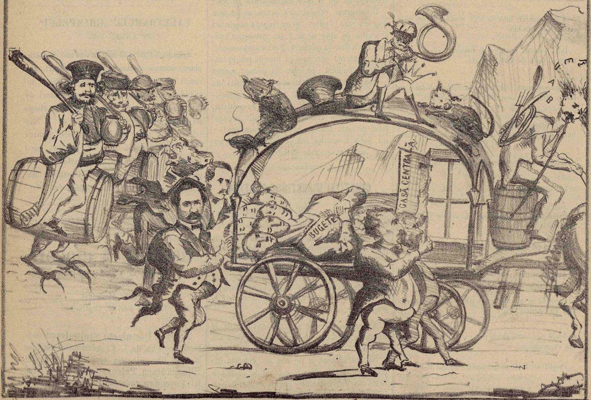
Dupe ce le nhatara și umflara și golira casa peste măsura, acum îi facu procesiunea la cimitir, pene cându procesiunea li se va face și lor și lor procesiunea