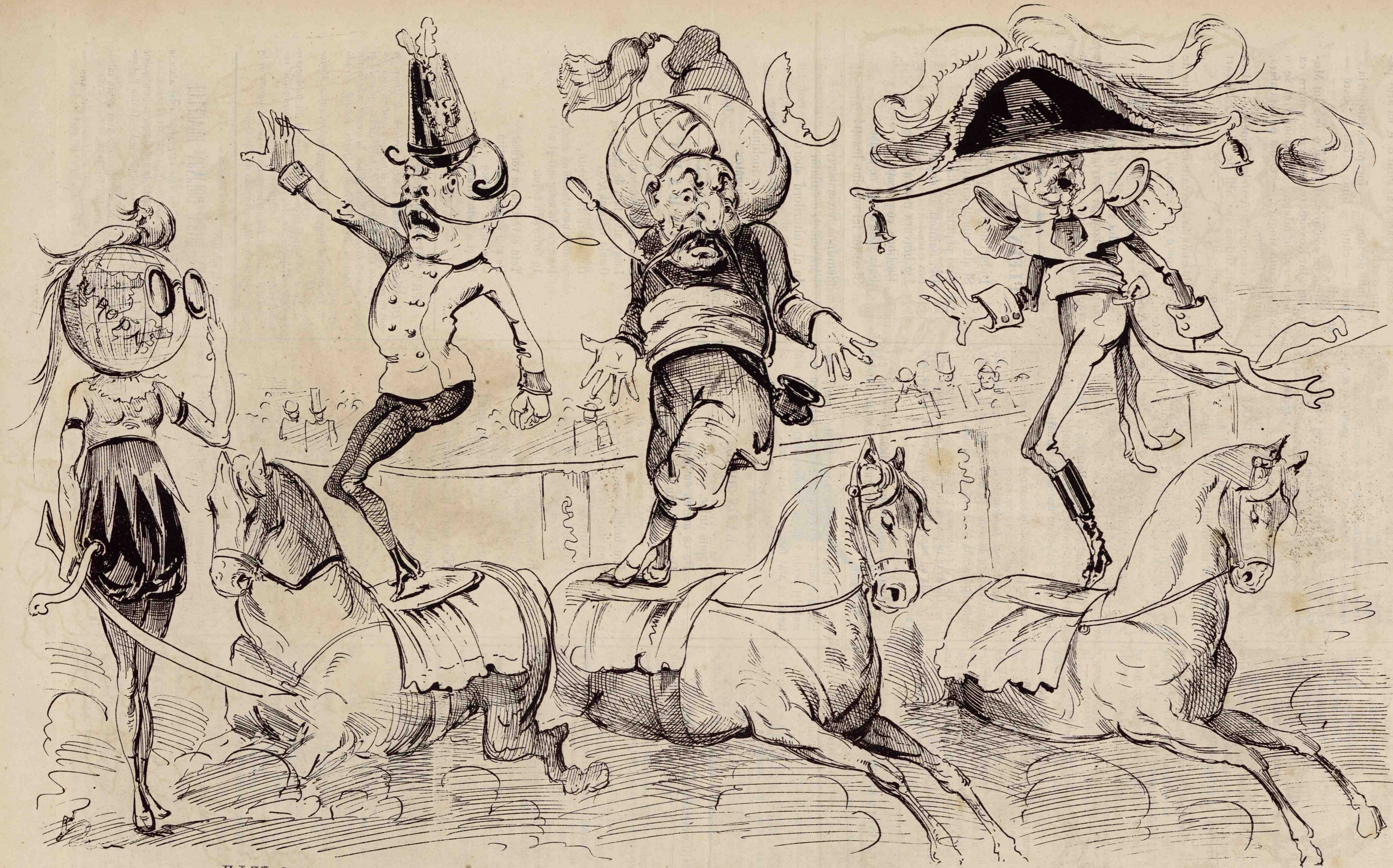
Echilibristii noștri au ajuns pe șovăite! Încă puțin și i vom vedea tumba. Așa este când capetele sunt prea grose și corpul prea suptire.