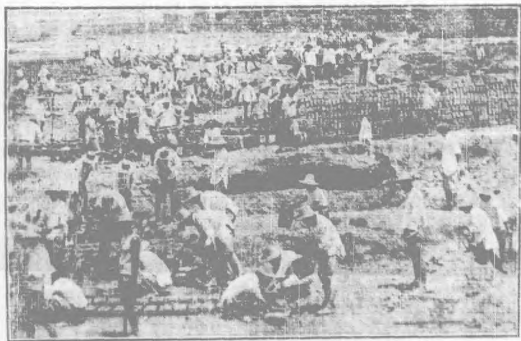
五十路軍修建營房官兵脫土坯之工作情景

「背談」人有兩種害處：第一：一般人惱怒他和他爲仇。第二：真主把他的短處顯揚給一些人。並且他所「背談」的那人如果是真有那樣短處，這就是「背談」，如果沒有像他所說的那樣事實的存在，不惟「背談」，且爲說謊。