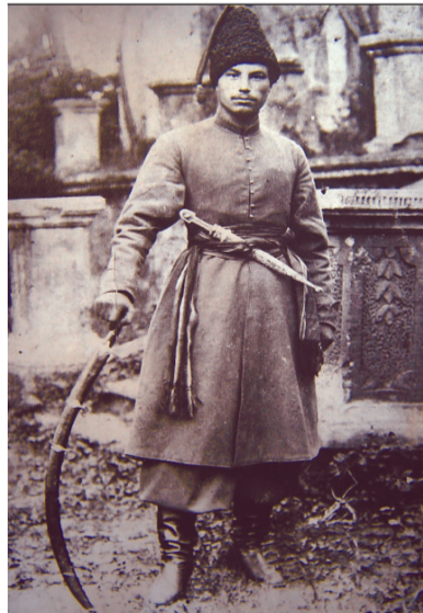
Петро БОЛБОЧАН (5.10.1883 – 29.06.1919, ст. Балін)

Військовий діяч; командир 1-го Республіканського полку (з осені 1917), командир 2-го Запорозького полку і 1-ї Запорозької дивізії (1918), Запорозького корпусу (з 11.1918), командувач Лівобережним фронтом Армії УНР (1918); звання – полковник Армії Української Держави та Армії УНР. Визволитель Криму. Вічна слава!