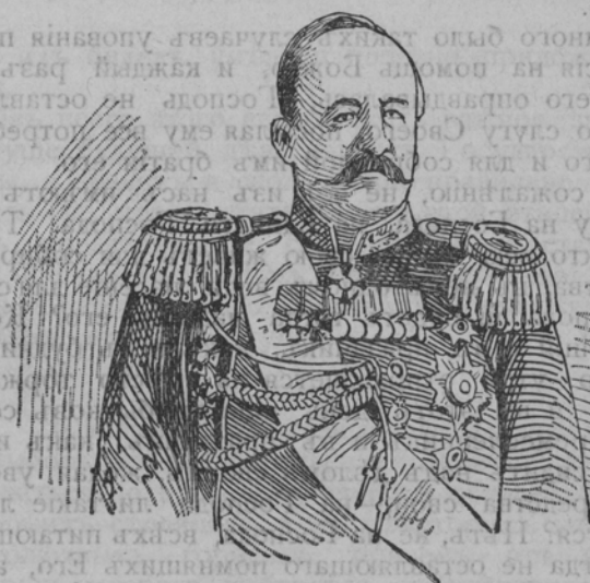
Намѣстникъ Его Величества на Кавказѣ

генераль-адъютантъ графъ И. И. Воронцовъ-Дашковъ.