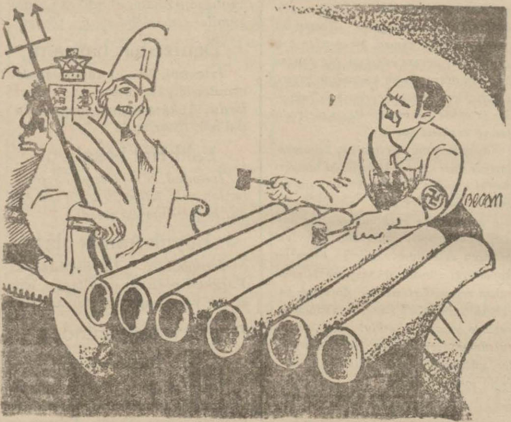
İngiltere — Bana "dörtler anlaşması, havasını çalsanız al" (La Republik, Paris)

Seçim işleri bu değişiklik üzerinde ne dereceye kadar etki yaptı? Bunu kesin olarak belirtmek güçtür. Kesin olan İngilterenin, rahatça hüküm sürmek için Avrupadaki kuvvetleri birbirinden ayırmak yolundaki eski oyununa yeniden başladığıdır. Tanrı izin versin de, İngiltere günün birinde bu yüzden acı acı eseflenmesin!