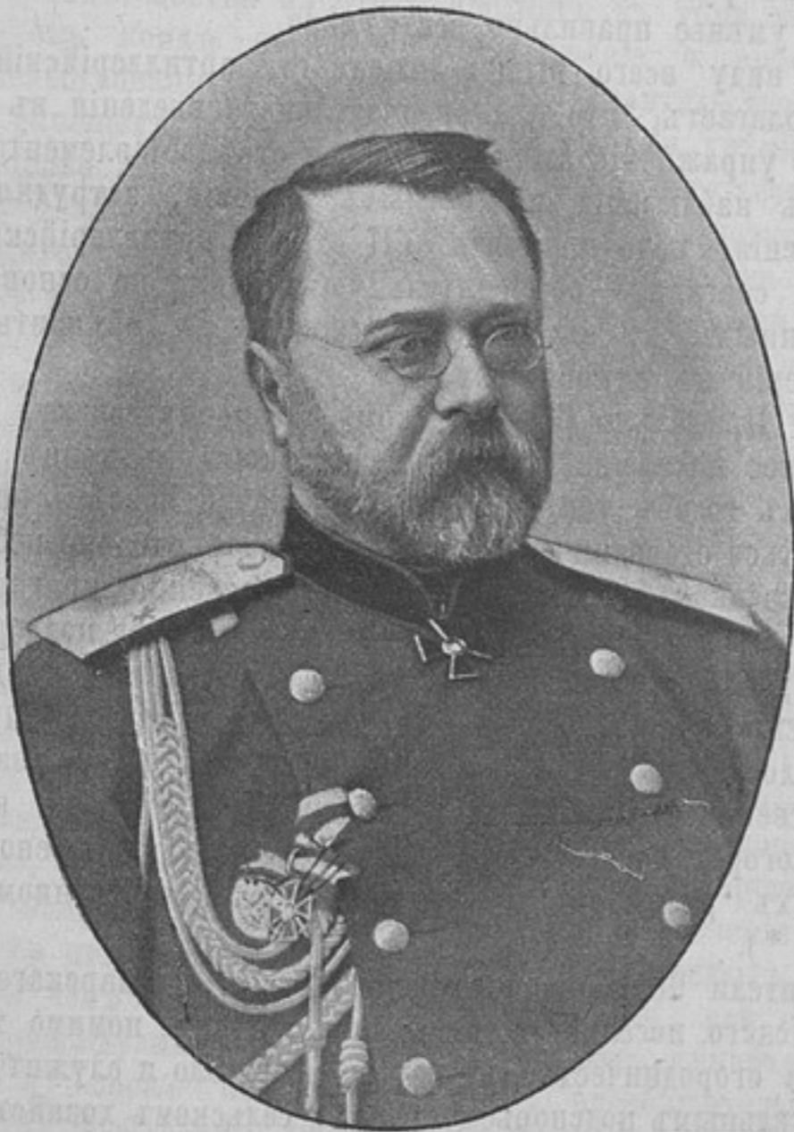
Начальникъ штаба Виленскаго военнаго округа, генераль-маіоръ

Требовать: изъ редакціи журнала «РАЗВѢДЧИКЪ», С.-Петербургъ, Колокольная, 14.