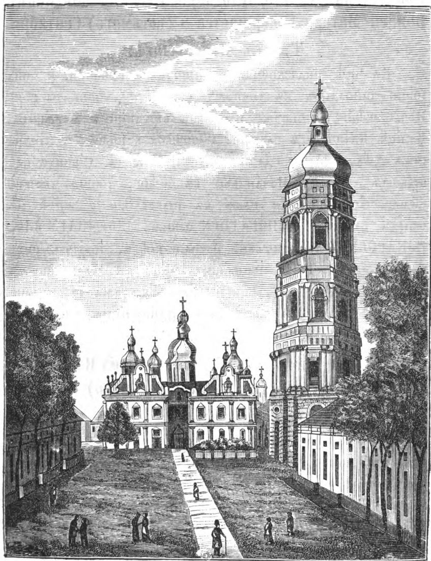
ВИДЪ КИЕВО-ПЕЧЕРСКОЙ ЛАВРЫ.