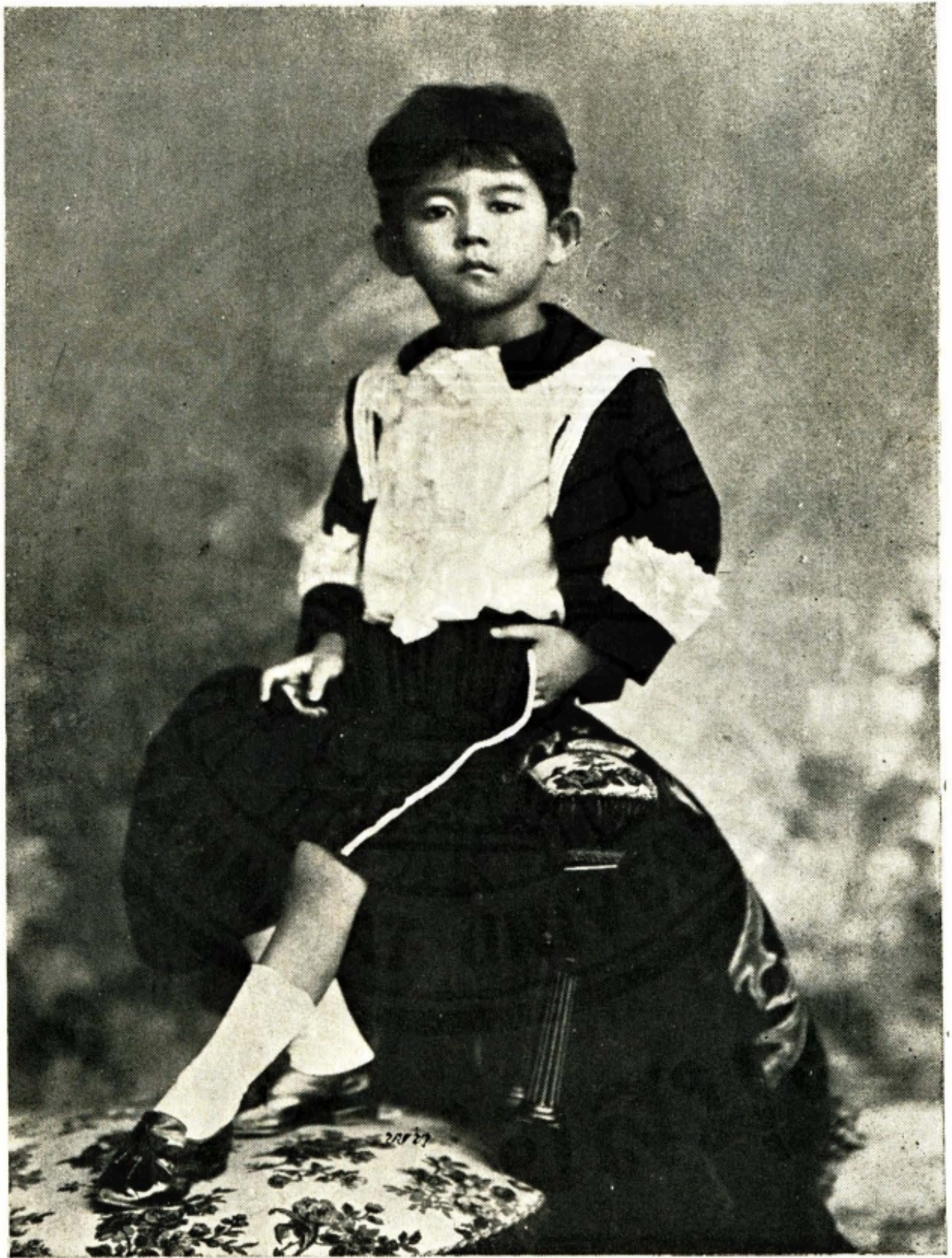
พระรูปสมเด็จพระเจ้าฟ้ามหิตลอดุลยเดช กรมขุนสงขลานครินทร์ เมื่อยังทรงพระเยาว์ ถ่ายเมื่อปีระกา พ.ศ. ๒๔๔๐ พระชันษา ๕