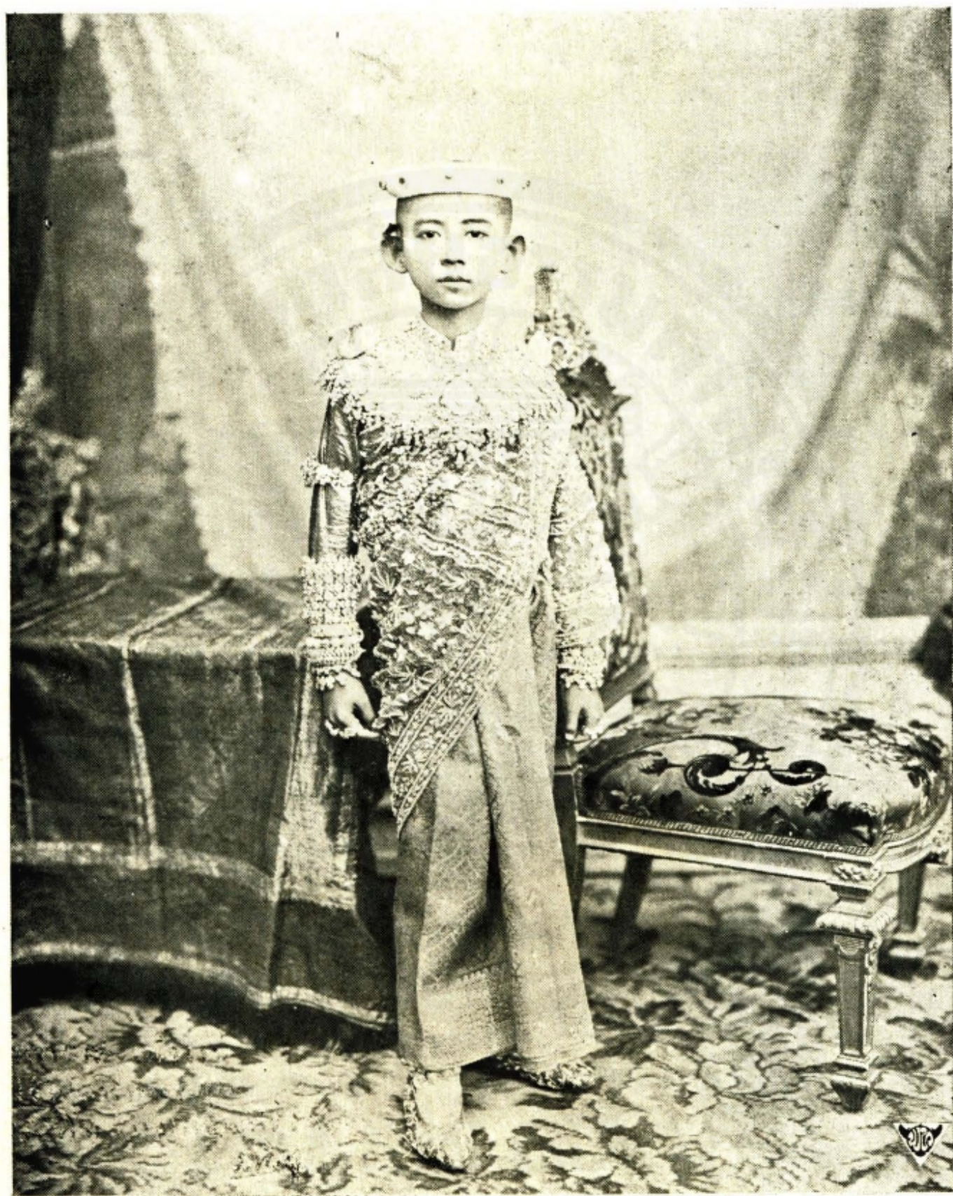
พระรูปสมเด็จพระเจ้าฟ้ามหิตลอดุลยเดช กรมขุนสงขลานครินทร์ ทรงเครื่องเมื่อโสกันต์แล้ว ถ่ายเมื่อปีเถาะ พ.ศ. ๒๔๔๖ พระชันษา ๑๓