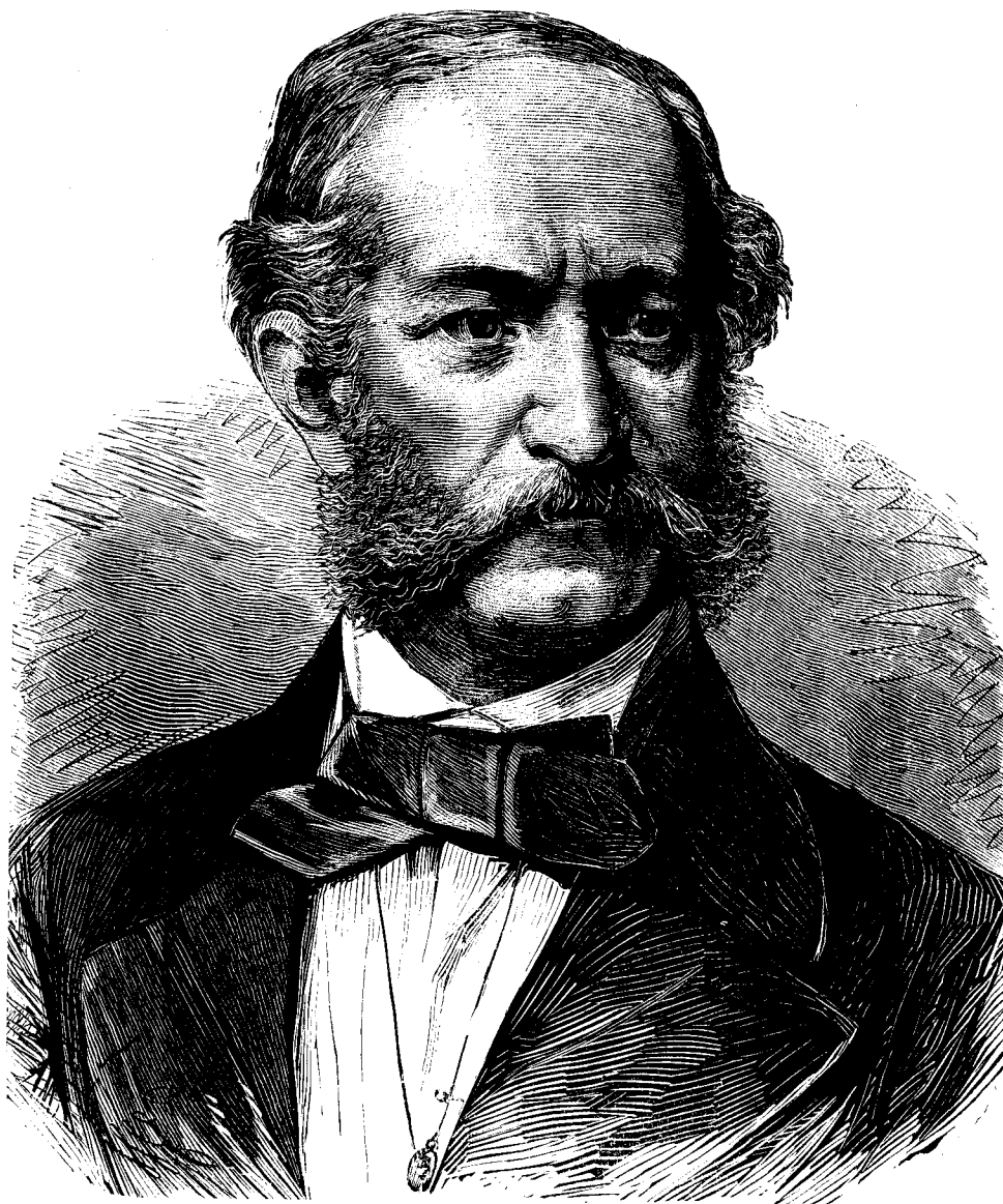
Br. Henricu Haymerle.

numai mai târdiu a obtinutu rangul de baronu. Întrându pe carier'a diplomatica, a trecut pe tóte treptele aceleia, pâna ce în urma fu numitu ambasadoru la Roma, de unde apoi se urcă în postul ce-l ocupa acuma.