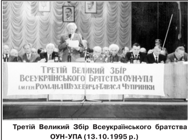
Третій Великий Збір Всеукраїнського братства ОУН-УПА (13.10.1995 р.)