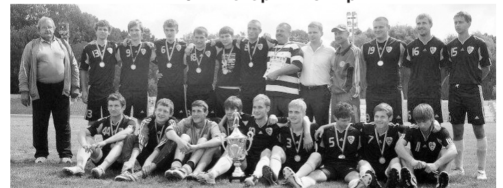
ФК «Колос» с. Мотижин. 2014 р.